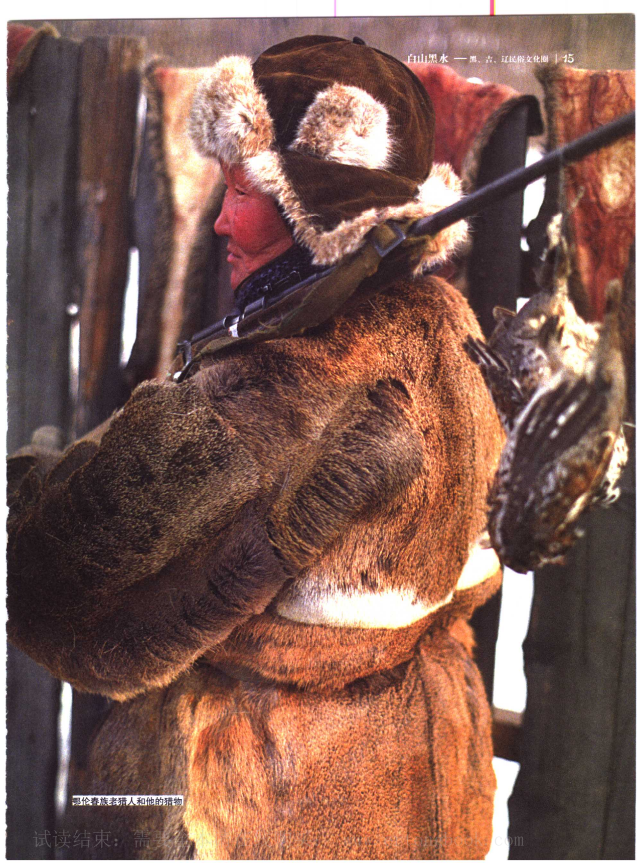
鄂伦春族老猎人和他的猎物