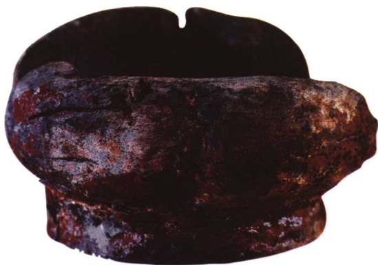
图1 新石器文化 朱漆木碗

那么我国漆器的制造始于何时呢？《韩非子·十过篇》载：“尧禅天下，虞舜受之，作为食器，斩山而财之，削踞修之迹，流漆墨其上，输之于官，为食器，诸侯以为益侈，国之不服者十三。舜禅天下，而