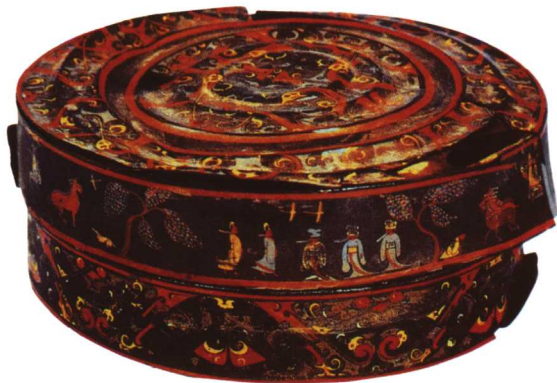
2 战国 彩绘人物故事图夹纻胎漆奁

从出土的漆器来看，楚国漆器以日常生活用品居多，包括家具，饮食器等。另见有文具、陈设品、乐器、兵器、车马件、葬器等。楚国漆器以木胎为常见，另有皮胎、竹胎、夹纻胎等。制作工艺有描漆、描金银、金箔贴花、错金银扣、