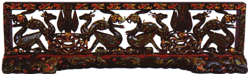
3 战国 彩绘透雕漆座屏

针刻等。其图案精美，描绘细腻，图案内容有几何纹、动物纹、漆画三种，尤其漆画的艺术成就最高。一般来讲，楚国漆器上的彩绘以反映社会生活题材和神话传说中的人物和动物为主。图2彩绘人物故事图夹纻胎漆奁，高10.4厘米，直径28厘米。1987年出土于湖北荆山门包山2号楚墓。奁为夹纻胎，圆形，直壁，平底，子母口。内壁髹红漆，外壁髹黑漆为地，用红、黄、金、蓝、褐、白等色彩绘。盖顶中间两条线条粗壮的圆圈内，绘有两组对称的云纹，每组云纹内绘八个对称的凤鸟纹。盖壁绘有二十六个人物，分别为御者、乘者、待者，车马四乘，十五匹马，五株树，一头猪，两条狗，九只大雁。所画内容为楚国贵族行迎场面。画面构思精巧，布局慎密活泼，人物鸟兽形神毕肖，为我国漆器中的珍品。楚国漆器在彩绘的同时，还广泛采用雕塑的手法，使器物更加