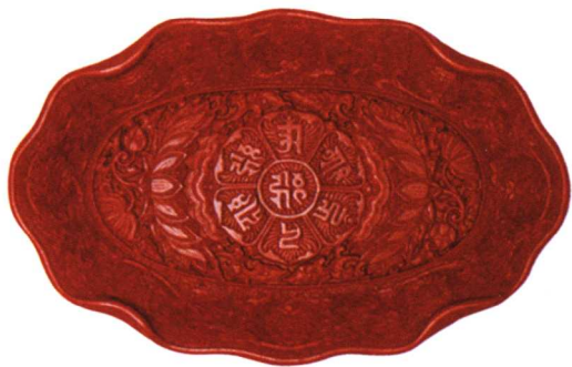
12 明宣德 剔红梵文海棠形盘