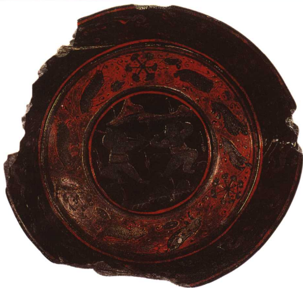
6 三国 彩绘童子对棍图漆盘

木胎，敞口，浅腹。盘内以黑漆为地，正中绘两个身戴肚兜，光着屁股的童子舞棍对打，形象天可爱。构图饱满而生动，极具写实的韵味。鱼纹、水波纹、莲蓬及云龙纹均活灵活现。盘外壁及底髹黑漆，底正中红漆书“蜀郡作牢”四字，为三国时漆器中的精品。需要提及的是朱然墓中曾出土两件犀