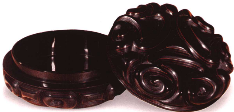
11 元 剔犀云纹盒

中，首见有一件宋代黑漆六瓣盘，盘心有白色螺钿嵌梅花一枝，纹饰极为典雅。宋代漆器的一大特色是多有铭文。