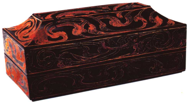
5 西汉 彩绘盨顶长方形漆奁

以彩绘为主，纹饰以人物故事为常见，特别是表现宴乐的图案为以前所不曾见有。图6彩绘童子对棍图漆盘，口径14厘米，1984年出土于安徽马鞍三国朱然墓。