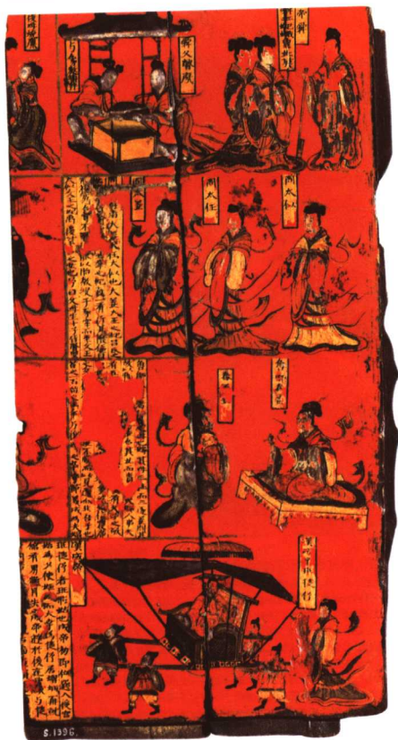
7 北魏 彩绘人物故事图屏风

宋代漆器在唐代基础上继续繁荣，据《宋史·职官志》记载，隶属工部的文思院：“掌金银，犀玉工巧及彩绘、装钿之饰”。宋代漆器多为出土器，亦有大量的传世品。漆器的品种十分丰富，应以日常生活用具为主。有光素漆、戗金漆、雕漆、描漆、螺钿漆五大品种。光素漆又谓一色漆，以黑漆为主，兼有红色、褐色、黄色、赭色等。器物的外底或底部多有朱漆铭文。戗金漆是在朱色或黑色漆地上用尖锐物划出花纹，纹内填漆，然后将金或银箔粘上去。图9戗金柳塘图长方盒，高11厘米，长15.4厘米，宽8.3厘米，1977年江苏武进村前宋墓出土。木胎，髹黑漆为地，盖面以戗金法做柳