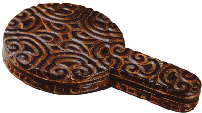
10 南宋 剔犀云纹执镜盒

塘图。柳树、水塘、游鱼、水藻的线条细致流畅。纹内戛金、空间之处密钻低凹的细斑点纹，点内填朱漆磨平，形成布满红点的斑纹地。盒盖内侧用朱漆书“庚申温州丁字桥麻七叔上牢”铭文。为我国漆器工艺中填漆戛金最早的实物。雕漆在文献记载中始于唐代，但未见有实物，宋代雕漆器物较多，又