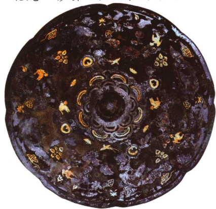
8 唐 羽人飞凤花鸟纹金银平脱漆背铜镜