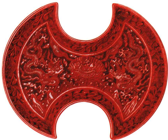
13 明嘉靖 绿地剔红双龙圣寿万年银锭形盘

刀法娴熟，纹饰的边缘圆润光滑，不见有棱角和刀刻痕。图12剔红梵文海棠彩盘，高2.6厘米，长23.9厘米，宽15.3厘米。盘为海棠形，盘内开光雕有梵文，两旁为莲花。盘边用浅浮雕之法饰缠枝莲托八宝纹，压在方格锦地之上。足内有“大明宣德年制”刀刻填金竖款。纹饰逼真，刀工精细，漆纹重重相叠，为宣德雕漆之佳品。