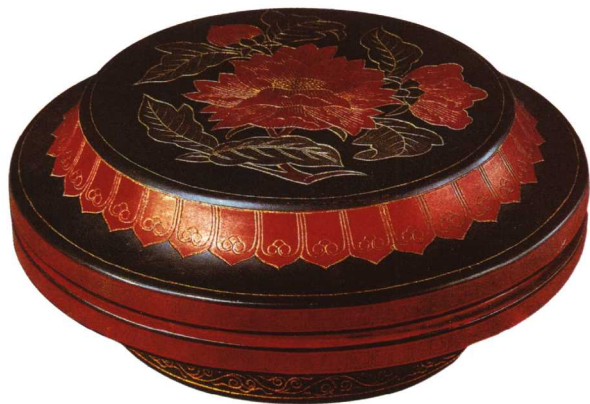
14 明宣德 戗金彩漆花卉盒

制”楷书横款。图案繁缛，雕工细腻，为嘉靖时精品。戗金漆在明代不甚流行，而戗金彩漆的艺术成就颇高，所谓戗金彩漆是戗金与彩漆相结合的一种工艺。即在漆地上按照设计的纹样剔刻出花纹，内填各色漆