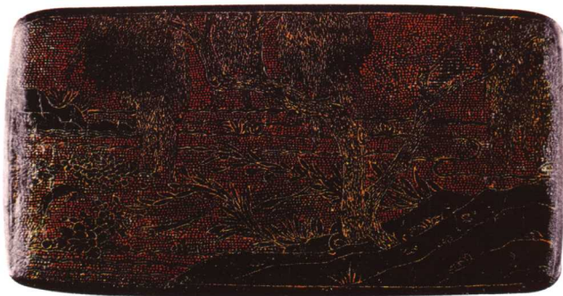
9 南宋 戛金柳塘图长方盒