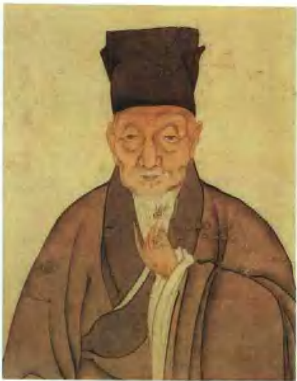
文徵明像(清·李任公绘)

三、县二。生员之数，府学四十人，州，县依次减十，师生月廩食米八六斗，有司给以鱼肉。学官月俸有差。生员专治一经，以《礼》、《乐》、《射》、《御》、《书》、《数》设科分教。……提学官在任三年，两试诸生。先以六等试诸生，谓之岁试。一等前列者，视廩膳生有缺，依次补充。其次增补广生，一二等皆给赏。三等如常。四等杖责。五等则廩、增递减一等，附生降为青衣。六等黜革。继取一二等为科举生员，俾应乡试，谓之科举。其补充廩增给赏，悉如岁试。其第等仍分为六，而大抵多置三等。三等不得应乡试，杖黜者仅百一，亦可绝无也。