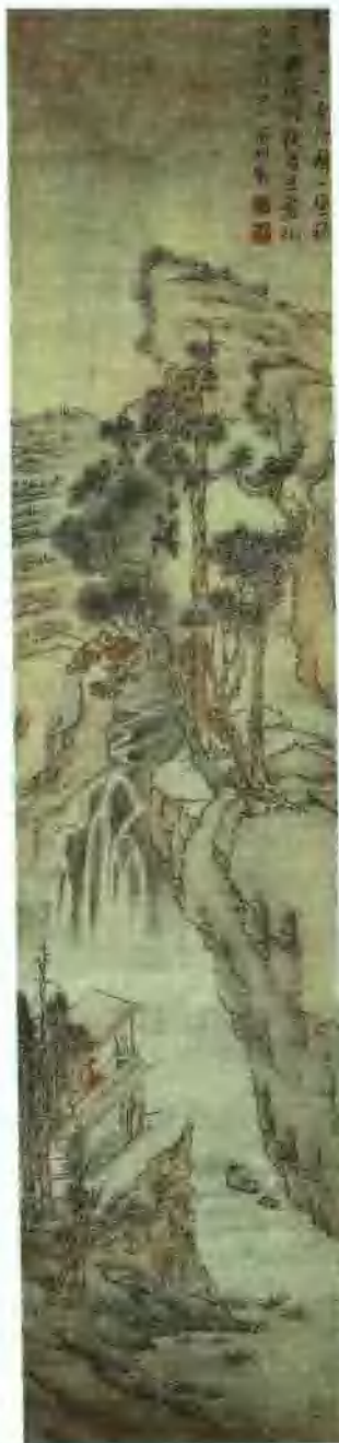
沈周声泉图 115 × 29cm

沈集此文，“弘治乙酉”应为“弘治己酉”。一是因为弘治朝没有乙酉年，二可据《艺苑掇英》第三十四期《沈文合作山水图卷》文徵明跋校正。实际上，文徵明在邑中为诸生时，就已开始“习绘事” ① 。他在谒见沈周之前，已经画了六七年的画，而且文氏家藏古代名迹不少，文徵明得以通过观摩临仿古代名作来自学。当然，他在绘画上的发展，还是在游于沈周之后。可以说，文徵明对沈周是推崇倍誉的，他常向人称“我家沈先生” ② ，文徵明后来在《跋沈石田竹