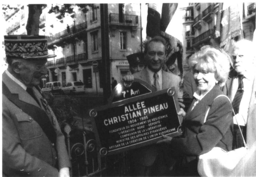
为了纪念克里斯蒂安·比诺，巴黎的一条街被命名为比诺大街。（右二为比诺夫人）

科学狂人企图以更高的价格把它买去，以便进行非法的生物实验。没有办法，齐克只好逃走，它想回到狼群中，但狼群不接受，还想把它吃掉，幸好它及时吹响号子，把狼群镇住了。