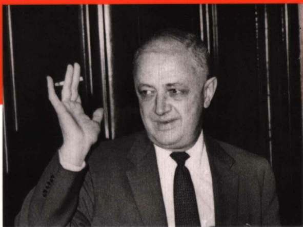
克里斯蒂安·比诺是法国杰出的政治家，1956年出任法国外交部长。（摄于1957年）