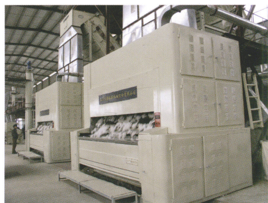
锯齿轧花成套设备系列