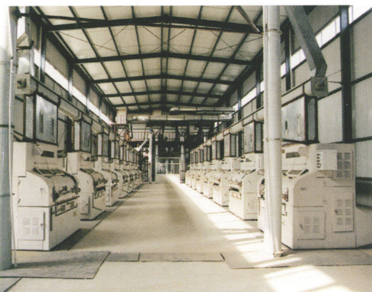
棉籽剥绒成套设备