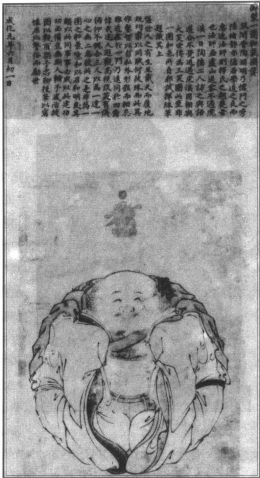
图2 一团和气图 明·朱见深

八大山人(1626—1705?),原名朱耷,号雪个,江西南昌人。他是明朝皇室的后裔,