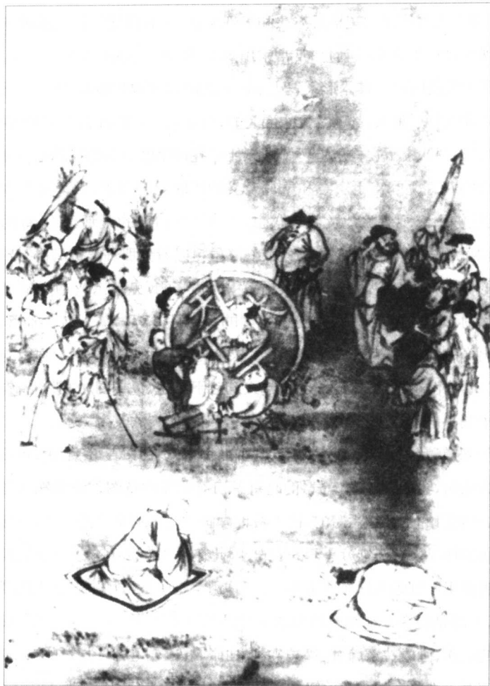
图7 铜钱眼里翻跟斗 清·佚名

图册》中有一幅叫做《铜钱眼里翻跟斗》(图7),这本来是根据民间流传的讽刺语言创作的,原意是讽刺那种财迷心窍的人,但这幅画中所描绘的在铜钱眼里翻跟斗的人却是使用锯、凿、斧、钻等工具的劳动工匠,作者有可能是站在丑化劳动人民的立场上来进行创作的。这表明在阶级社会里,以讽刺见长的漫画的创作目的和社会功能如何,总是受到作画者本身所在阶级的立场观点的制约的。