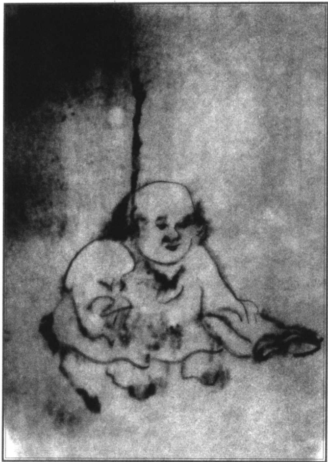
图5 鬼趣图(第四幅) 清·罗两峰

《鬼趣图》描绘的就是这种阴气森森的“鬼”的世界。罗两峰为什么要画“鬼”?《鬼趣图》到底在讽刺什么?只要我们结合画家所处的时代背景来考察,就不难了解作品在当时的现实意义。罗两峰生活的时代,阶级矛盾和民族矛盾十分尖锐,清王朝的腐朽和反动日益加剧,在满族贵族和汉族大地主阶级联合政权的残酷统治下,人民生活极端困苦,同时清朝统治者又通过大兴“文字狱”以摧残反封建反民族