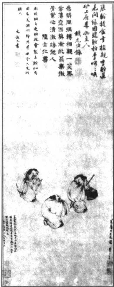
图3 三驼图 明·李士达

明亡后,他怀着家国之恨,出家当了和尚,后来又当了道士。八大山人是清初杰出的水墨大写意花鸟画家。他的一些讽刺画,常常采用象征、寓意的手法,表达自己对清朝统治者的仇恨和不满。《孔雀图》(图4)正是这样的作品。这幅画的上部画了一层石壁,石壁后面垂着竹叶和牡丹花,下面画着两只丑陋的孔雀站在上下大小不稳当的石头上,孔雀尾巴上有三根花翎。清朝的高级官员,帽子后面都有孔雀尾巴做的花翎,是皇帝赏给的,它标志着官的等级。画中孔雀尾巴上的三根花翎,正是用来象征当时帽子后面拖着三根花翎的清朝高级官员。画上配了一首意味深长的诗: