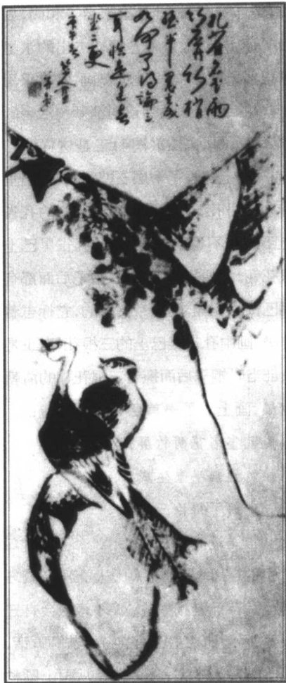
图4 孔雀图 清·八大山人