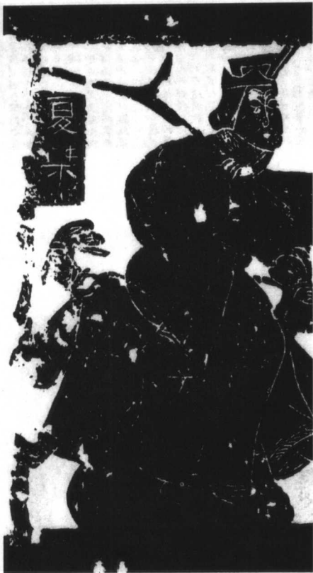
图1 夏桀 东汉·山东武梁祠石刻

代十国的后蜀(925—965)至北宋初年。文献记载说：“恪性不羁，滑稽玩世。”“虽豪贵相请，少有不足，图画之中必有讥讽焉。”“多为古僻人物，诡形殊状，以蔑辱豪右，西州人患之。” ① 作有《鬼百戏图》、《钟馗氏图》、《玉皇朝会图》等。他的讽刺画的创作目的和所要抨击的对象是很明确的，这就是“讥讽”“豪贵”，“蔑辱豪右”。石恪通过自己的创作表达了他对剥削压迫人民的“豪贵”、“豪右”所采取的“讥讽”和“蔑辱”的态度，这是他的讽刺画最值得人们称道的可贵之处。他在某些描写鬼神的作品中，“多用己意”，借题发挥讽喻社会现实。如《玉皇朝会图》中“欲调后人之一笑”的腰系鱼蟹的“水府官吏”，难道不正是对当时腰悬紫金鱼带的朝廷达官的尖刻讽刺吗？画家对“神”或对“鬼”的讽刺，说到底，