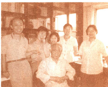
1996 年 8 月与子女合影