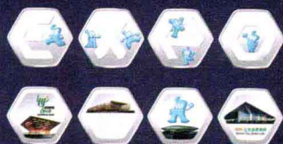
中国2010年上海世博会纪念章