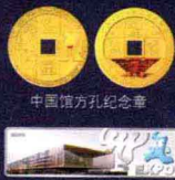
中国馆方孔纪念章