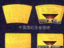
中国馆纪念金银砖