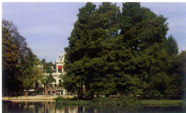
左 荷蘭阿姆斯特丹Vondelpark公園以河流來營造綠化空間一景。