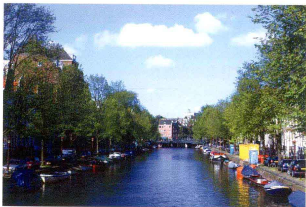
上 荷蘭阿姆斯特丹的城市運河。

波斯造園中水池與河流的形式元素。因維蘇威火山爆發而於西元79年掩沒的龐貝城，其中出土的壁畫仍保留了當時花園的圖像，噴泉水池庭院、花架廊柱圍籬、雕塑裝飾等，已具備私人別墅觀賞花園的規模。