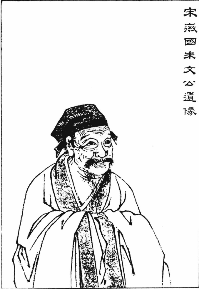
朱 子 像