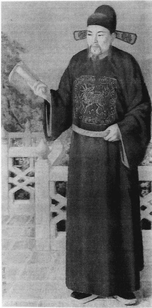
李梅樹教授繪 華岡博物館珍藏