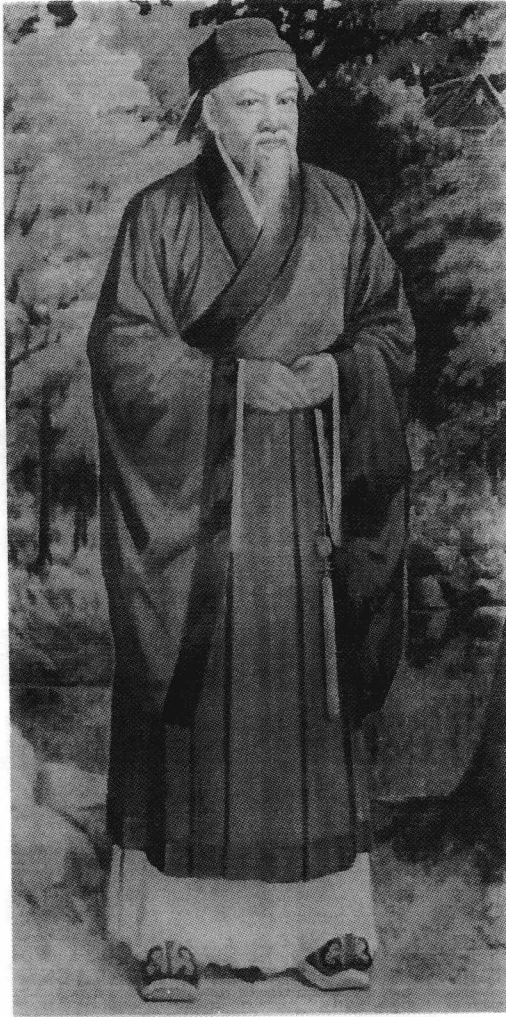
李梅樹教授繪 華岡博物館珍藏