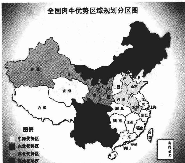
图 1.1 全国肉牛优势区域规划分区图

种之一的延边牛，以及蒙古牛、三河牛和草原红牛等地方良种。近年来，品种的选育和改良步伐进一步加快，育成了著名的“中国西门塔尔牛”，成为区域内的主导品种。