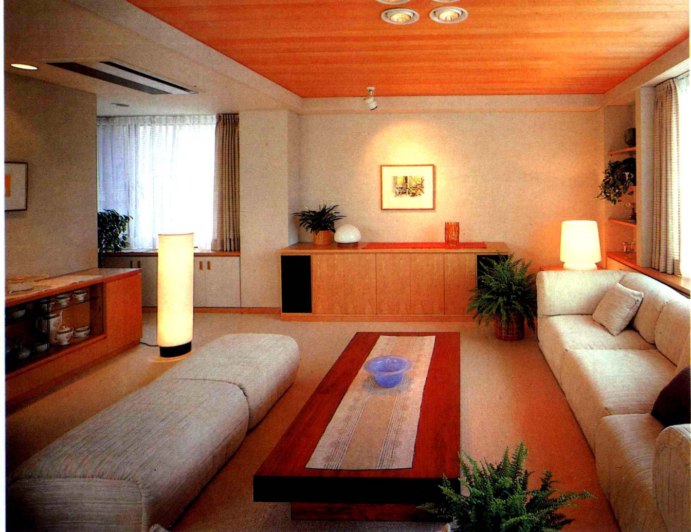
從不同角度所見到的客廳情景。