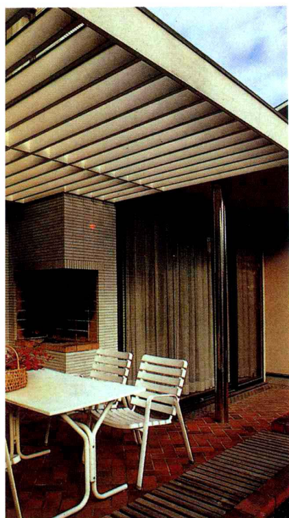
乳白色的休閒桌椅予人舒暢感