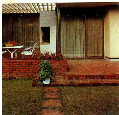
從陽台可欣賞到外面的綠草。