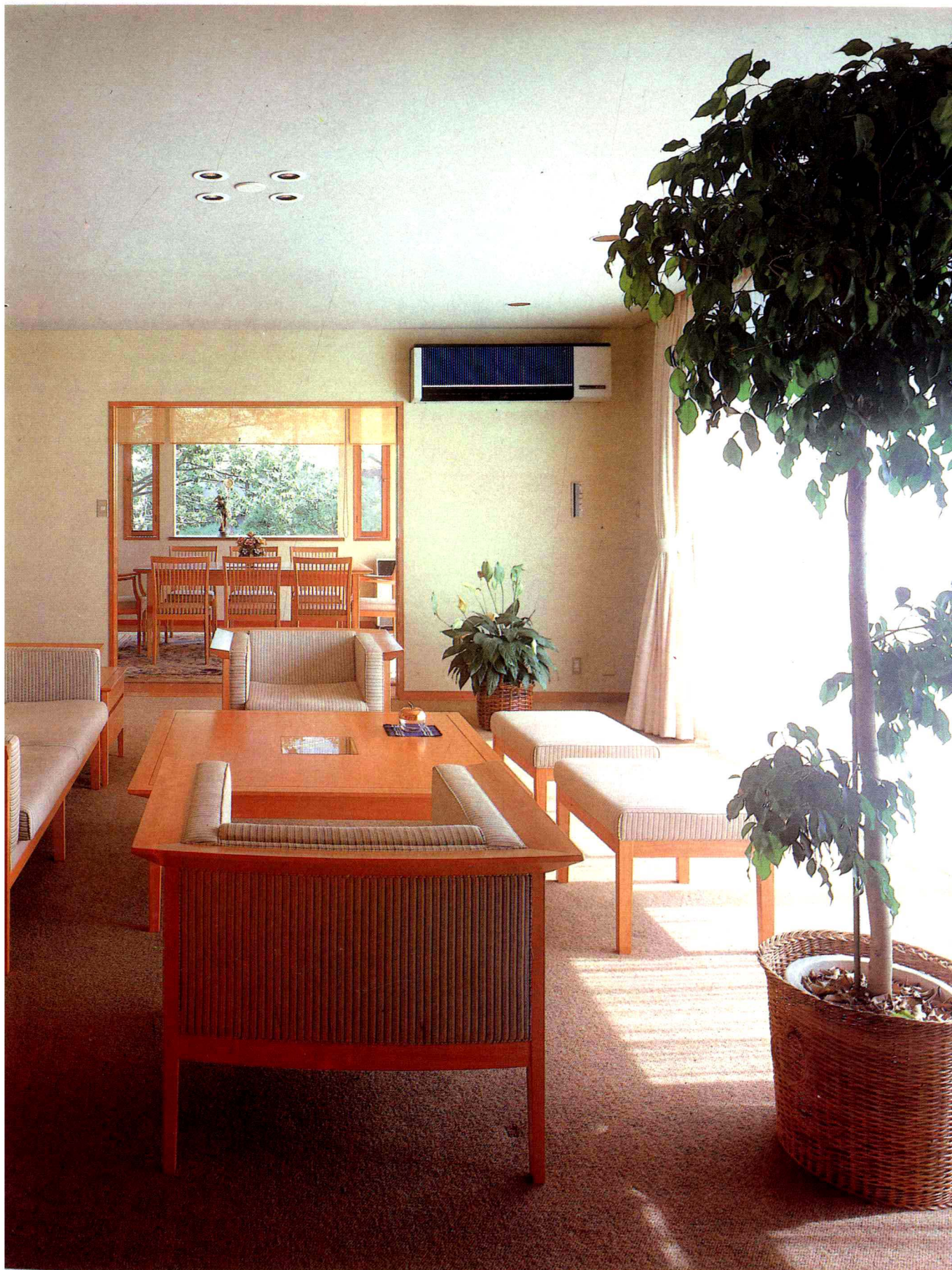
明亮的採光、整齊的擺設及色彩的搭配均恰到好處。