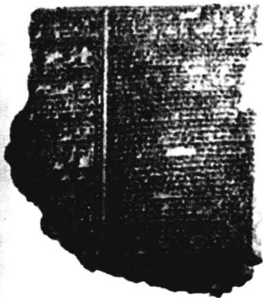
刻写着吉尔伽美什英雄事迹的泥版

备战完毕，安狄米恩命令当地的蜘蛛——它们数量众多，个头庞大，每只都有爱琴海上的岛屿那么大——用蛛丝在月球和启