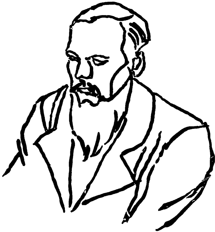
● 五十歲的杜斯妥也夫斯基 ●