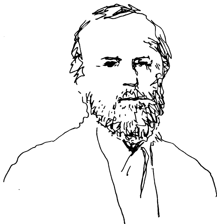
● 杜斯妥也夫斯基，一八六二年 ●