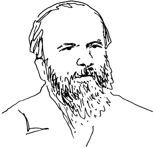
● 杜斯妥也夫斯基，一八八〇年 ●