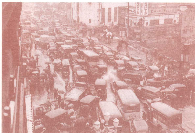
1936 年「二·二六事變」陰影下東京新橋附近的混亂車潮