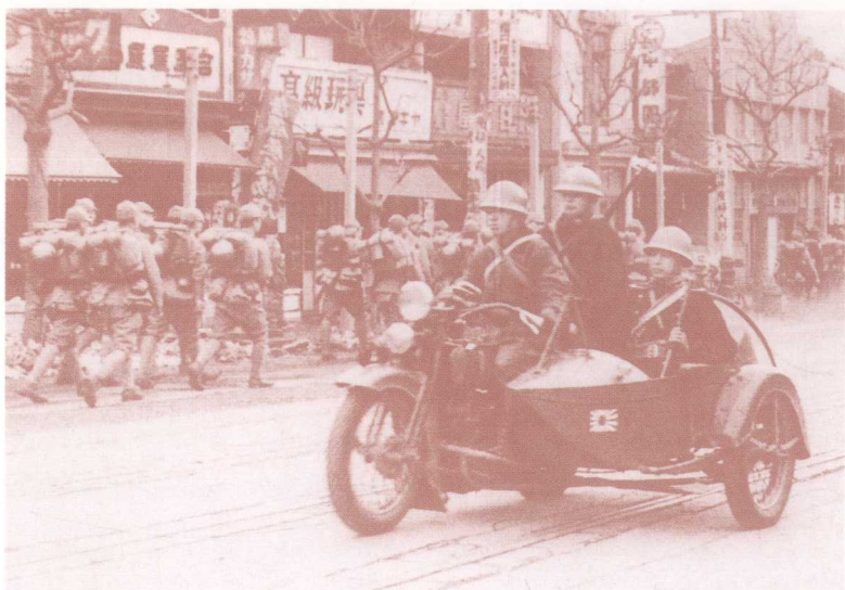
1936 年 2 月 27 日戒嚴令下達後，軍隊進駐東京的街景