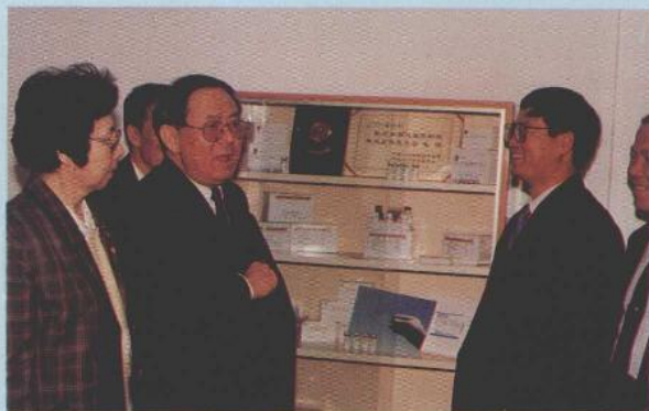
国务委员、国家科委主任宋健视察湛江