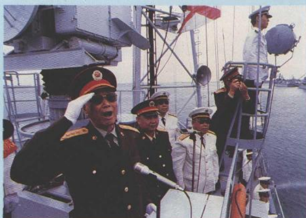
军委副主席张震视察南海舰队(王红)