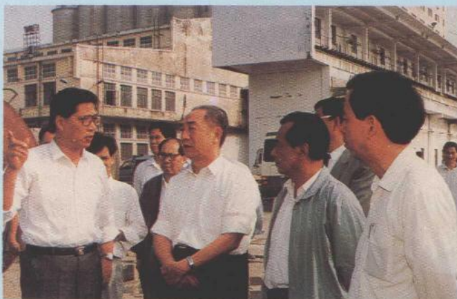
中共中央政治局委员、国务院副总理邹家华视察湛江