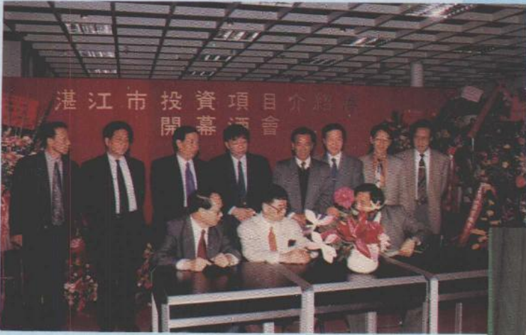
1993年香港投资项目介绍会