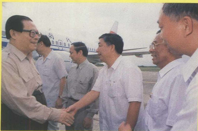
市委、市政府领导人在机场欢迎江泽民总书记

1993年9月23日至25日，中共中央总书记、国家主席江泽民在中共中央政治局委员、书记处书记丁关根，中共中央政治局候补委员、书记处书记温家宝，中央军委委员、总参谋长张万年和中共中央政治局委员、广东省委书记谢非，广东省省长朱森林，广州军区政委史玉孝等陪同下，亲莅湛江市考察。