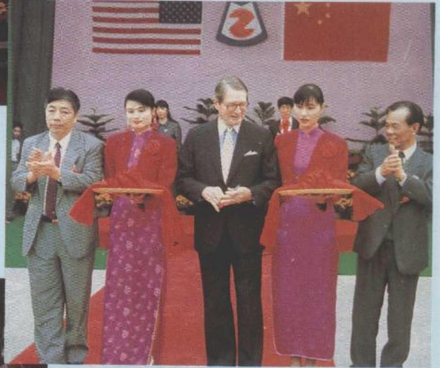
湛江中美化学工业有限公司首期聚苯乙烯生产线投产剪彩仪式