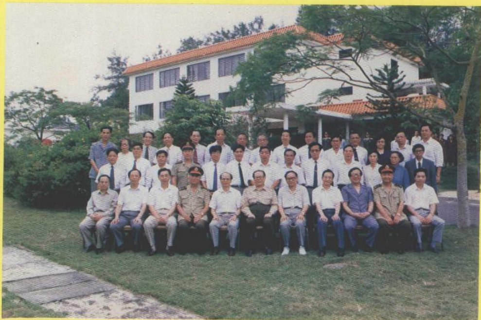
江泽民总书记一行与市领导成员合影

1993年9月23日至25日，中共中央总书记、国家主席江泽民在中共中央政治局委员、书记处书记丁关根，中共中央政治局候补委员、书记处书记温家宝，中央军委委员、总参谋长张万年和中共中央政治局委员、广东省委书记谢非，广东省省长朱森林，广州军区政委史玉孝等陪同下，亲莅湛江市考察。