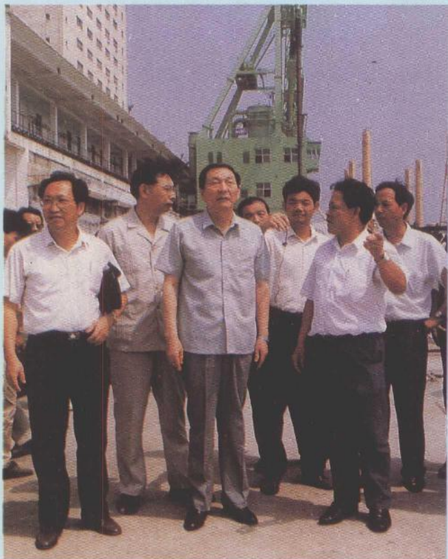
中共中央政治局委员、国务院副总理朱镕基视察湛江