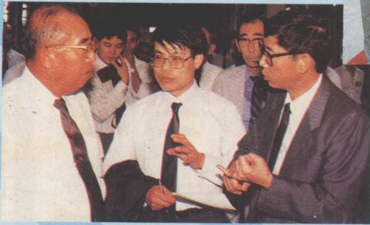
日本大发汽车株式会社江口会长参观三星企业集团公司