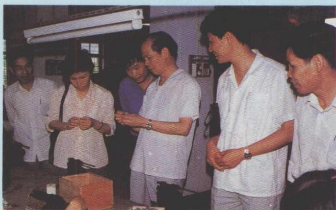
中共中央政治局委员、广东省委书记谢非视察湛江