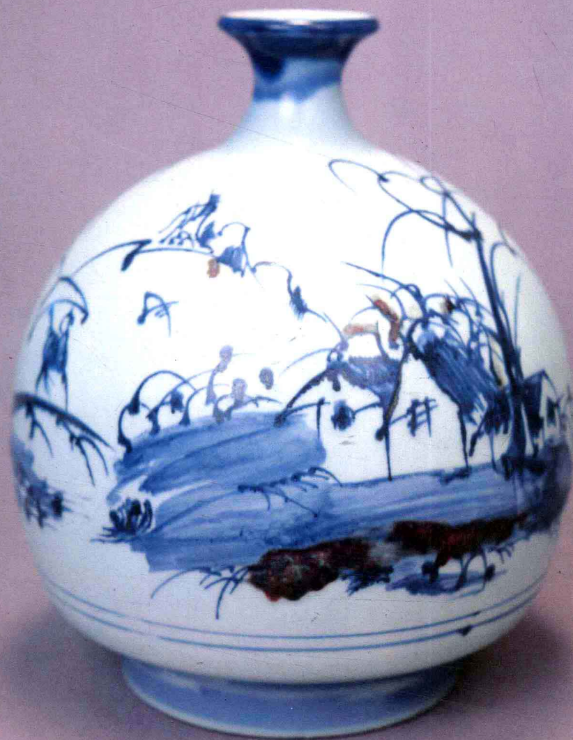
2. 民間山水 青花釉里紅玉壺瓶 劉影青 民間山水 青花釉裏紅玉壺瓶 劉影青 Folk Landscape Cyanic Flora Inner Red Enamel Jade Pot Bottle Liu Ying-qing 21.6X26.3