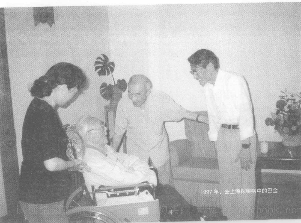
1997年，去上海探望病中的巴金