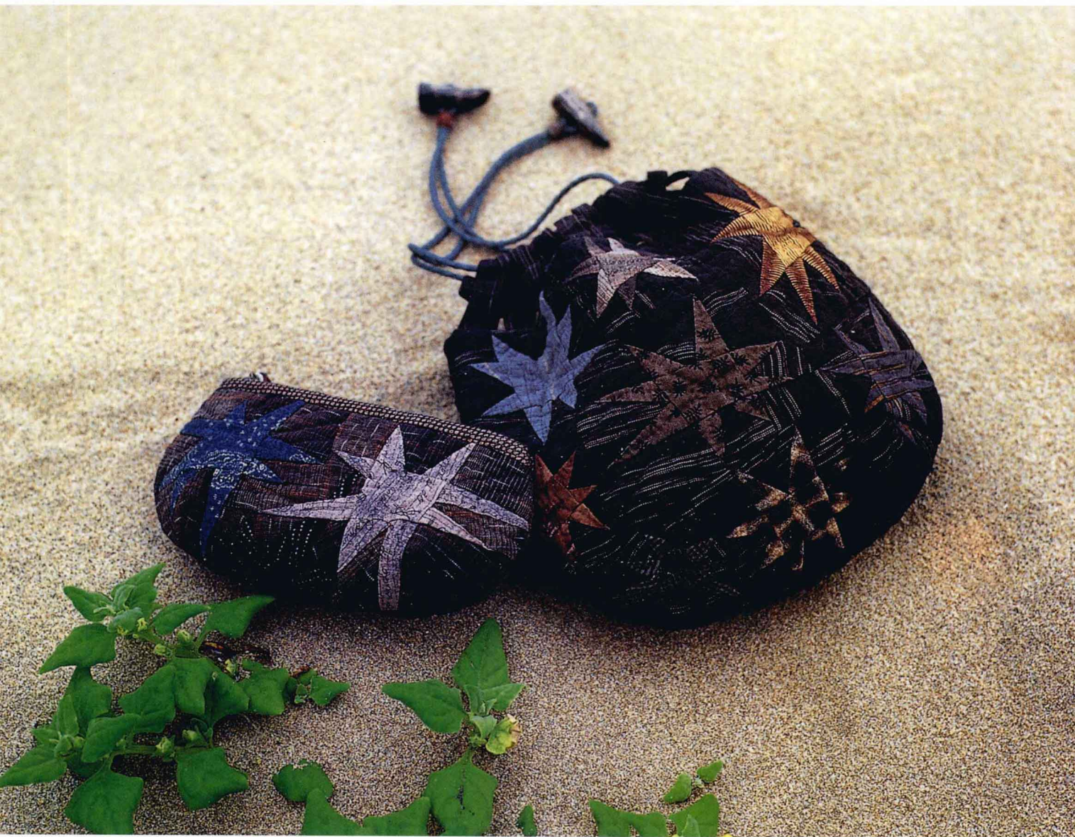
随身包 做法参照第79页

随身包上的变形大星星，看起来犹如海星图案一般。向外放射的光芒，使图案充满魅力、韵味十足。拉链穿上串珠，也是作品的设计重点。