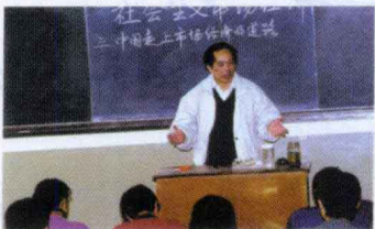
▲ 教授在讲邓小平理论