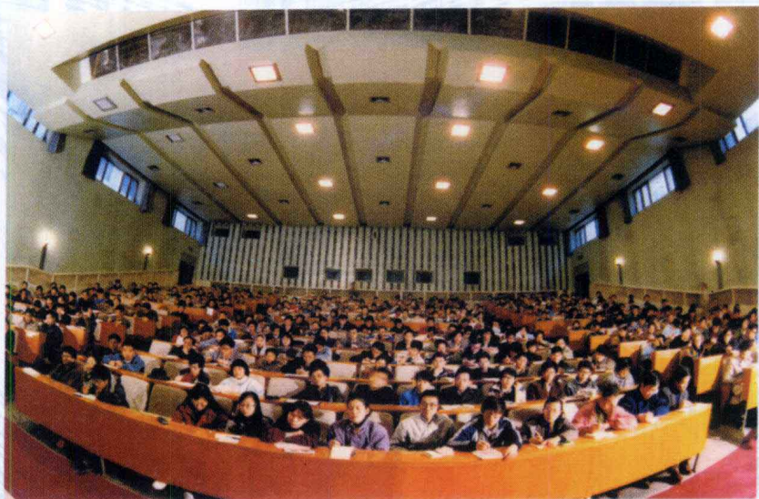
▲ 北大学生在礼堂上课