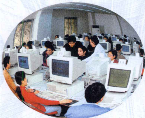
▲ 学生们在计算机中心