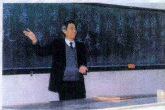
▲ 中文系教授在讲课