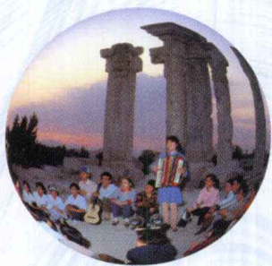
▲ 多姿多彩的文娱活动