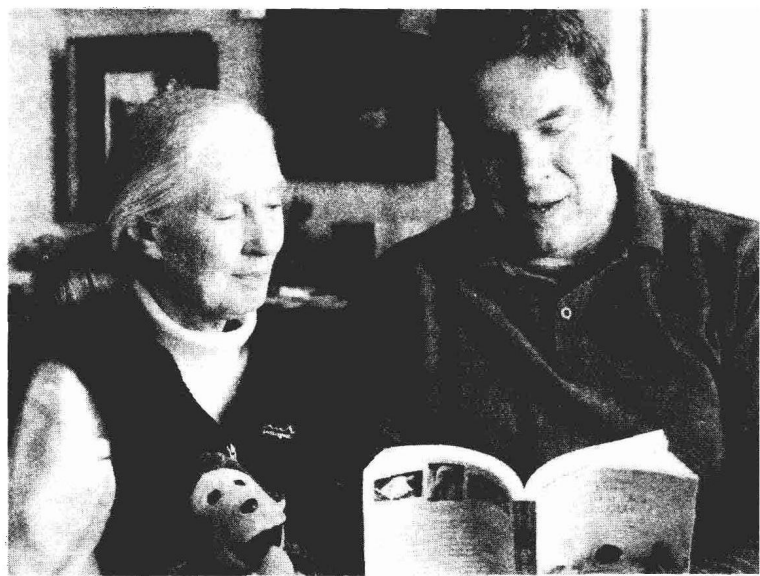
珍·古德和葛瑞格·摩顿森

葛瑞格是一个很“大”的人：身材高大，心胸宽广。他非常热情，同时又很温和，是我最欣赏的一类人。他已经实现了而且还正在创造着奇迹，在巴基斯坦，最近在阿富汗，他的努力让那里的孩子们了解到村庄以外的世界，对那些本来没有机会接受教育的女孩来说，尤其如此。葛瑞格（现在有他的组织“中亚协会”的帮助）的成就不仅是建学校，他赢得了人民的心，人民的信任，更是在为促进世界和平而努力，让更多的人认识到改变世界不应该通过暴力和战争。然而，成就卓著的葛瑞格，却依旧保持着谦逊平和。