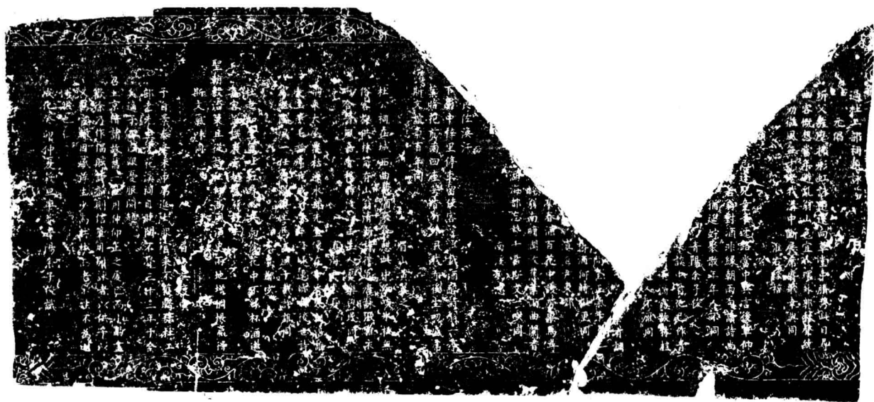
過杜工部祠題咏（全拓）