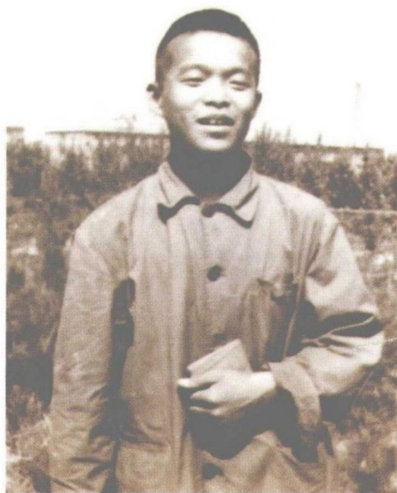
摄于“文化大革命”中，作者当时为中學生