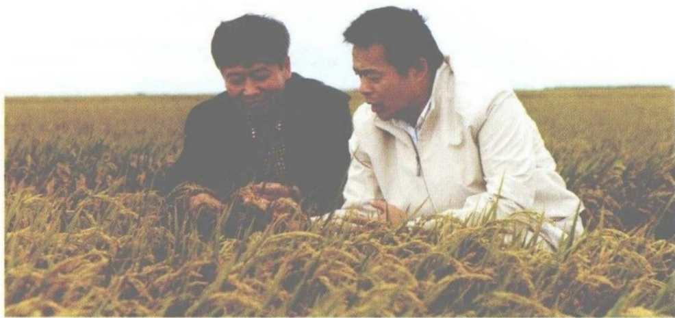
摄于2010年，作者赴黑龙江农垦总局调研期间参观当地农田