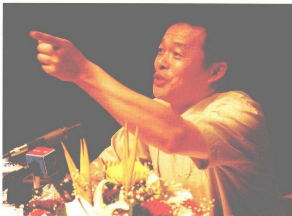
摄于2003年，作者为地方领导干部授课