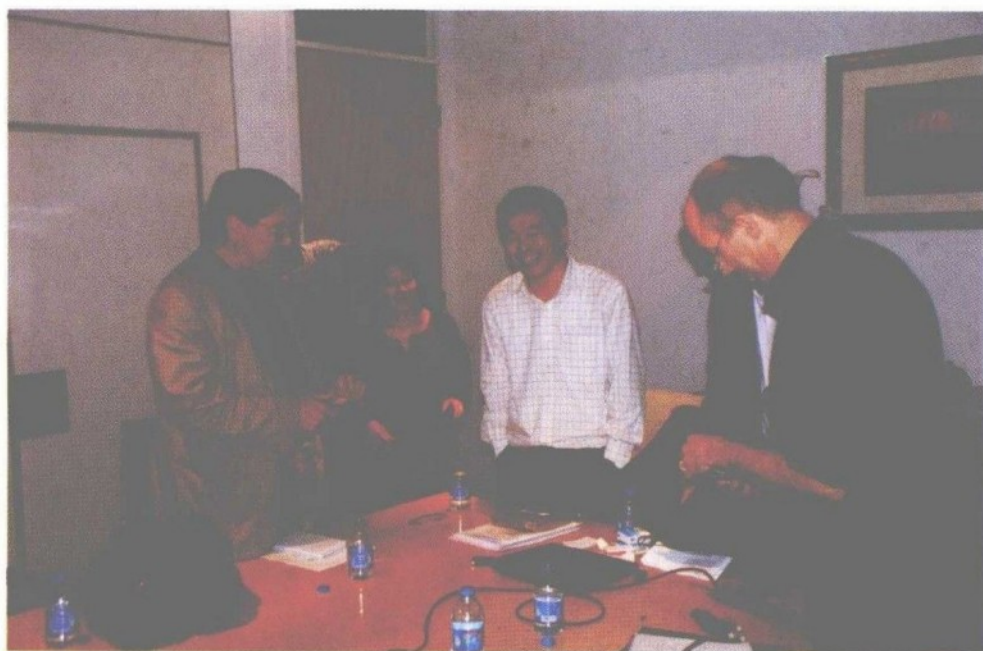
摄于2010年，作者接待美国主流媒体编辑访华代表团