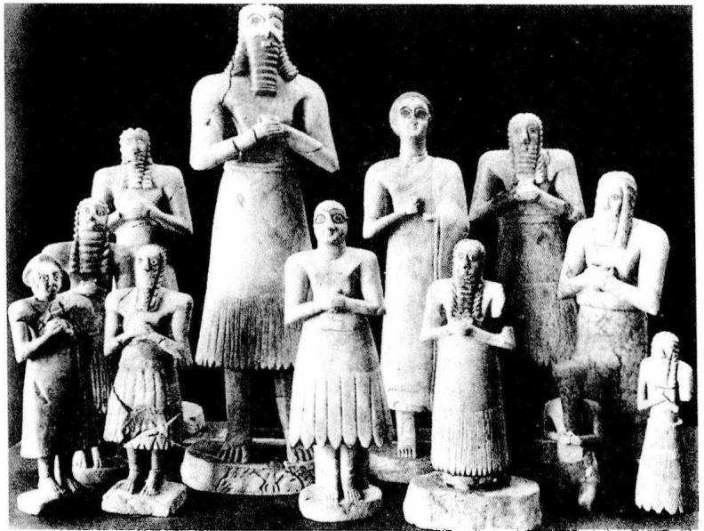
圖 1-1 圖中這些陶像乃是美索不達米亞帝國的祭司，他們虔誠地向上帝「安奴」禱告，祈求這位宇宙之主宰與眾神帶給人世間繁榮、富庶與和平。想想五千多年前的蘇美人與我們現代人對宗教的虔敬有什麼不一樣。

古代文化體系顯現一共同的特徵：宗教信仰與祭祀構成文化生活的重要部分；政治統治者必須結合宗教