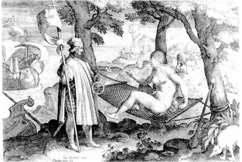
圖 1-0 左手持著羅盤，右手握著十字架之長矛，身配刀劍的歐洲人，乘坐戰艦，橫渡大西洋，來到美洲新大陸，首次遇到了原住民，這些原住民赤裸著身體，以天地自然為住處，樸陋無文，遠處還可見到他們正烤著人肉吃！（十七世紀荷蘭畫家所繪十六世紀西班牙的海外探險家首遇美洲土著）。從這幅畫中，你看到了什麼意象？歐洲的畫家為什麼把歐洲人男性化，而把美洲原住民女性化？

的文化經過長時間演化而形成，文化因時因地而有所變遷，如有古代與現代文化的差別。同時，民族的不同也使文化呈現繁複與差別性，如有中國與歐洲文化的差異。