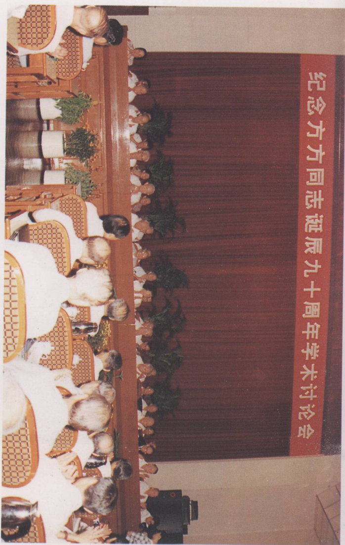
1994年7月13日，纪念方方同志诞辰90周年学术讨论会在广州召开。图为学术讨论会开幕式。