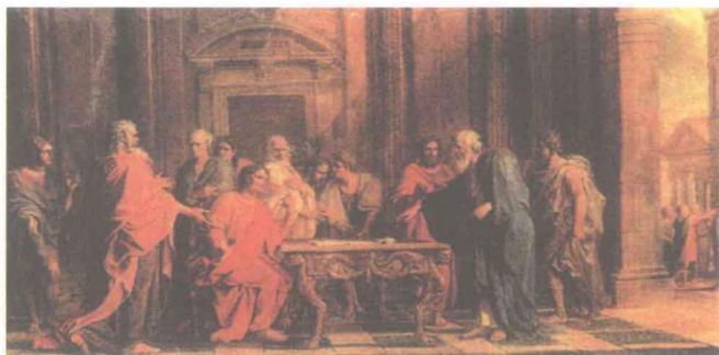
梭伦改革前夕贵族间的大辩论

拉米岛,使其面临的形势雪上加霜。萨拉米岛位于比雷埃夫斯港湾的入口处,距雅典海岸仅一英里,它扼守着雅典最重要的港口——比雷埃夫斯港。萨拉米岛的失守对雅典经济无疑是沉重打击。由于雅典国内矛盾重重,无法动员全国力量夺回港口,贵族担心平民力量乘机壮大,规定禁止再讨论夺回萨拉米之事。