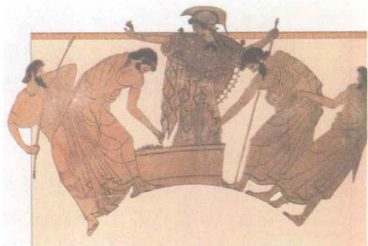
公民大会上,雅典武士在雅典娜的监视下投票

元社会格局,为雅典民主政治奠定了社会基础。梭伦的政治改革完善了雅典的国家制度,这些制度为普通公民参与国家政治活动提供了制度保证,为雅典民主政治建立了可靠的制度保障,到公元前5世纪,雅典民主政治发展到顶峰,所有雅典成年男性公民都有权参加国家政治,他们一生中至少有一次担任公职的机会。