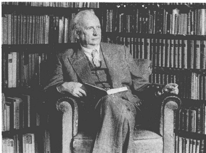
图 7.3 雅斯贝尔斯像

1931 年底，雅斯贝尔斯出版了他的三卷本大著《哲学》，他解释了此书涉及的问题即何为哲学——“凡我在同人们打交道时、在系里授课时、阅读报纸、走在街上以及外出旅游时所遇到的，尤其是在注意自己深爱的人们及其命运时所认识到的，这一切都得到表述，而这些表述的出发点则再也看不出来了。我在大哲学家们那里意识到的东西都被吸收过来，构成目前的真理。那些看起来极其偶然的