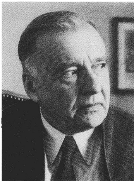
图 7.2 伽达默尔像