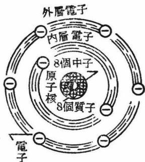
圖 1. 氧原子的構造

倍，質子帶有陽電，中子不帶電，電子帶有陰電。一個電子所帶的陰電是一個最小的電荷（即電的特性）。一個質子所帶的陽電，恰恰和電子帶的電量相等。一個原子在平常情況之下，原子核中所帶的陽電荷，和它周圍電子所帶的陰電荷，數量也是相等，所以就整個原子來說，它是