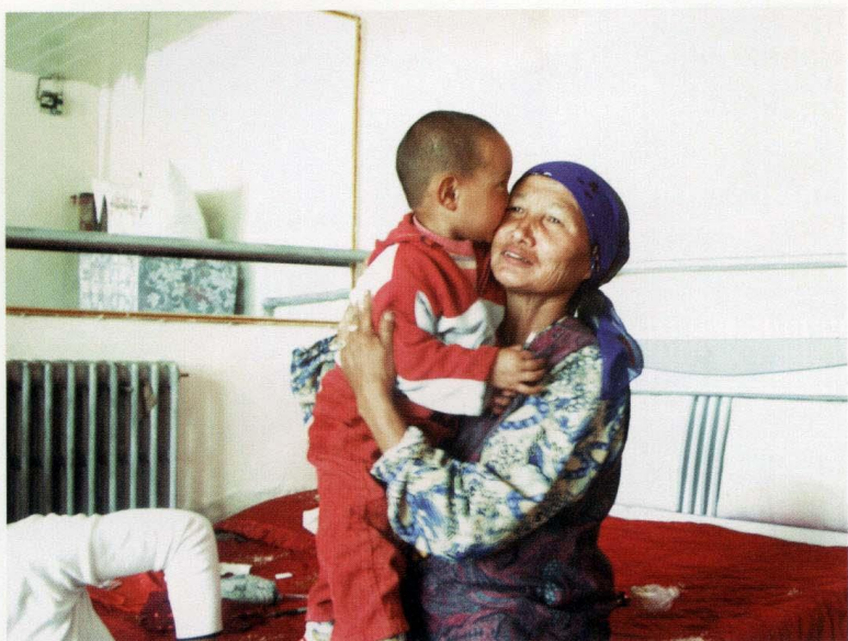
骄傲的母亲（摄于2007年9月7日）