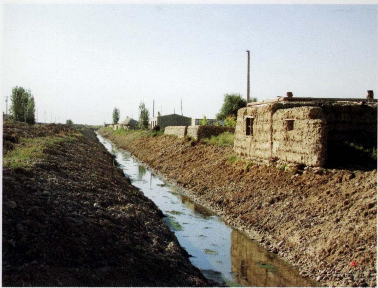
村落剪影 (摄于2007年9月9日)