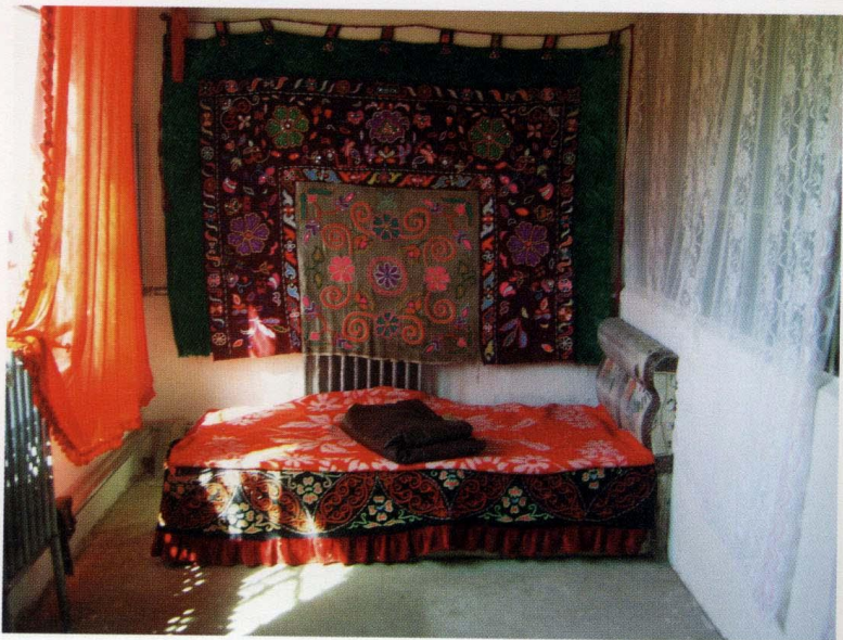
哈萨克族刺绣 (摄于2007年9月8日)