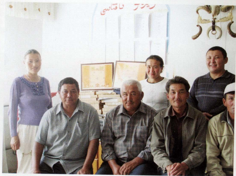
团结的集体（摄于2007年9月8日）