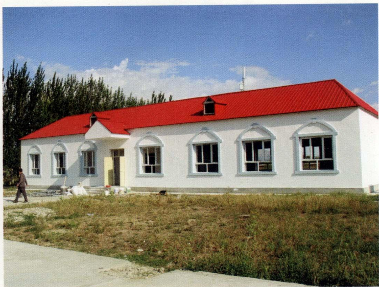
新落成的村委会办公室（摄于2007年9月9日）