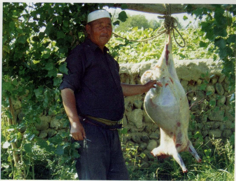
款待远方的客人（摄于2007年9月9日）