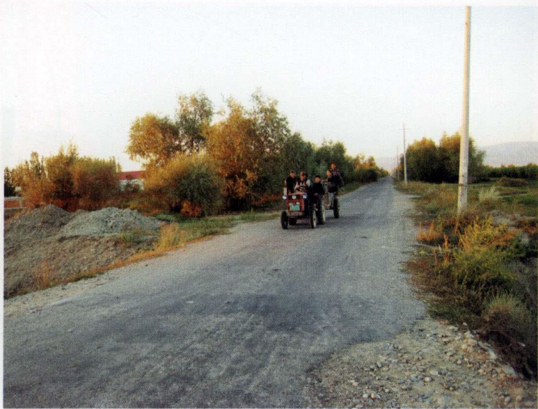
村公路 (摄于2007年9月9日)