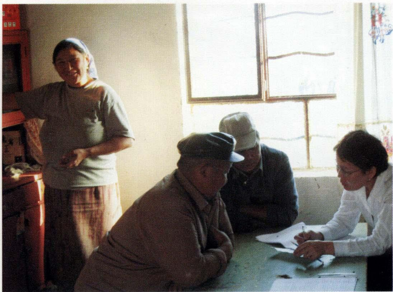
入户调查 (摄于2007年9月9日)