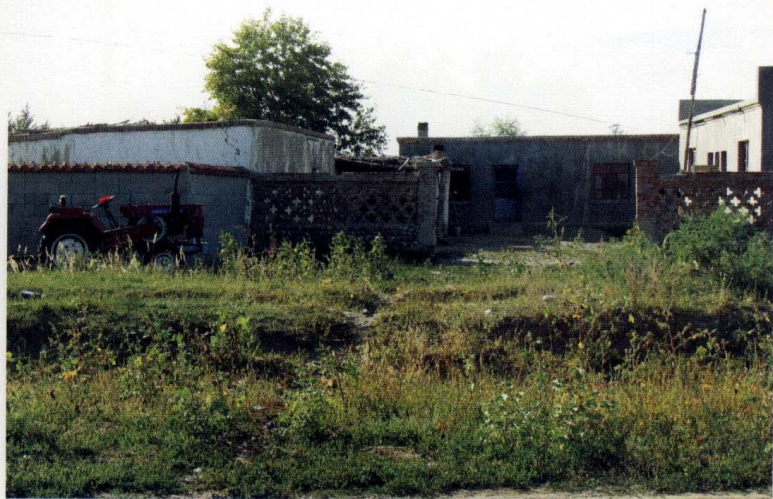
定居后的村民住宅（摄于2007年9月7日）