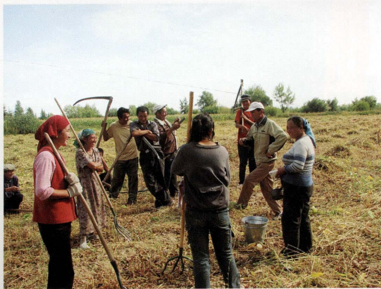
农闲时刻（摄于2007年9月8日）