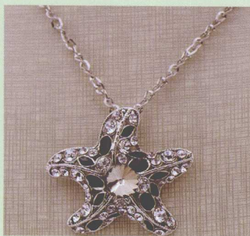
图4-19 在灰色背景布上拍摄