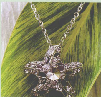
图4-20 把宝贝放在叶子上拍摄