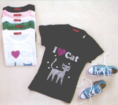
图4-10 平铺时适当点缀 ↗