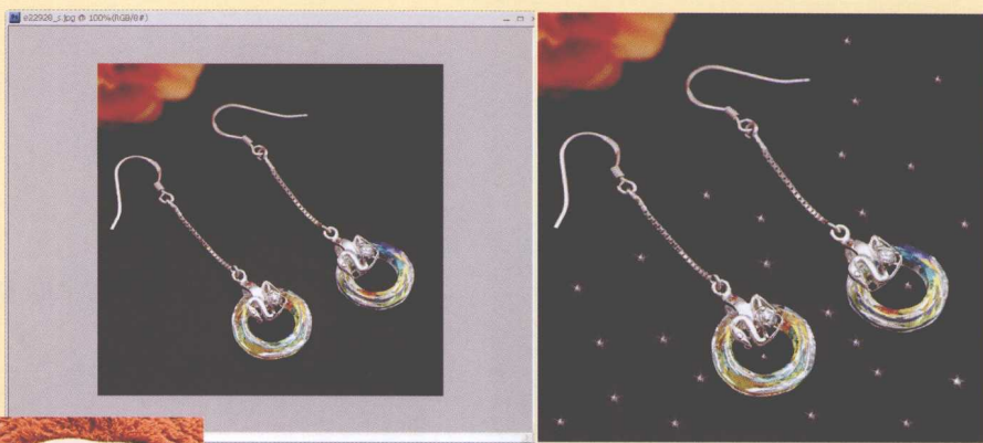
图5-74 原始图像 图5-86 闪闪发亮效果 ↗