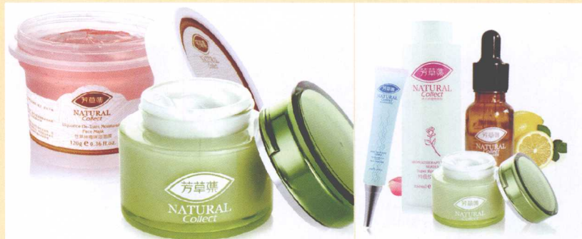
图4-16 多件商品一起拍摄