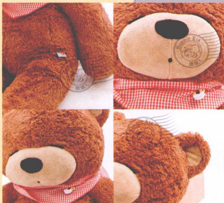
图4-29 从不同角度进行拍摄 ↖