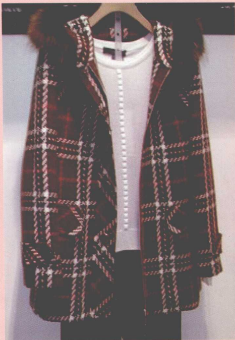
图4-5 没做任何修饰的挂拍 ↗