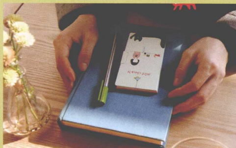
图4-26 商品与人物搭配