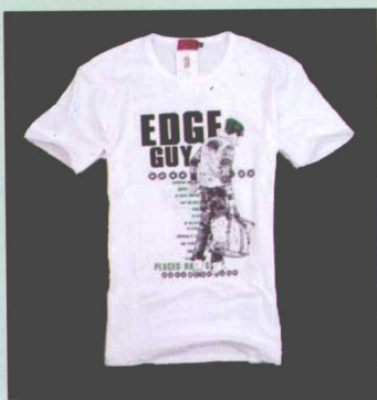
图4-8 底板拍摄 ↗