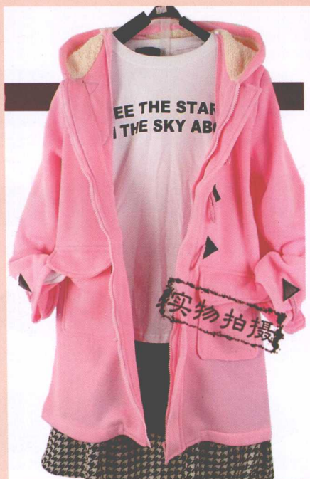
图4-6 花心思的挂拍 ↗