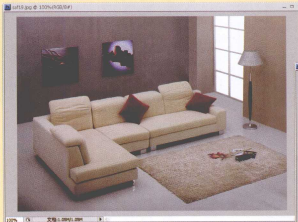
图5-55 需要 更换背景的图片