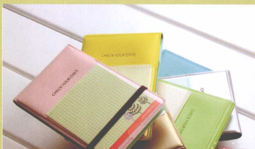
图4-24 商品与淡雅背景的搭配