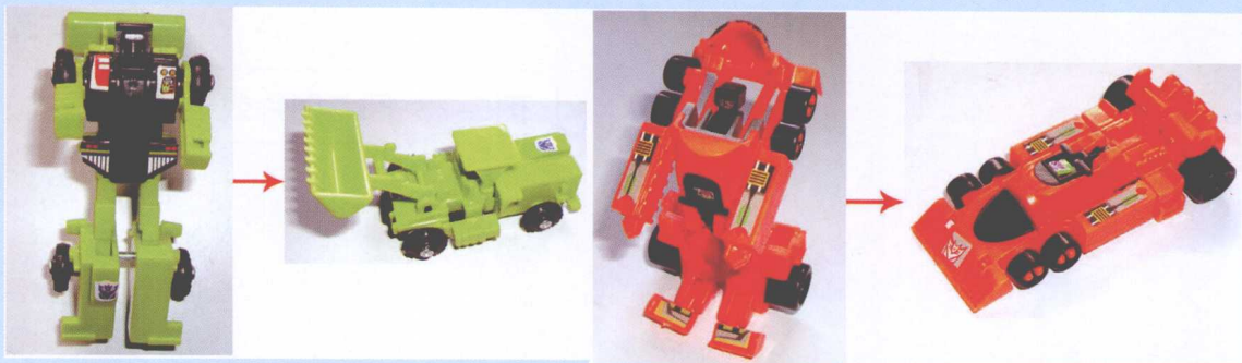
图4-27 变形前后的样子 ↗