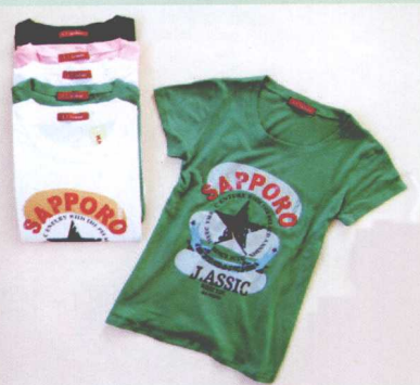
图4-9 平铺时光线均衡 ↗