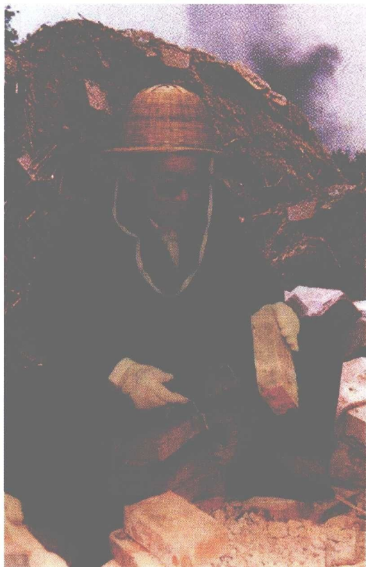
李瑞环同志参加平房 改造义务劳动