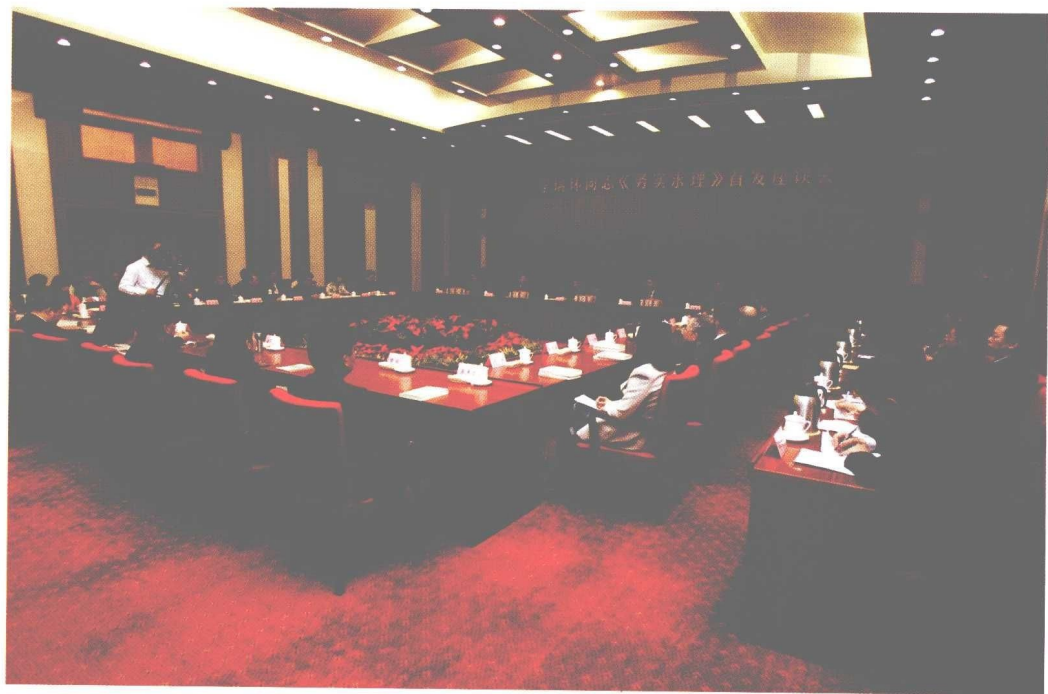
2010年4月23日，天津市召开李瑞环同志《务实求理》首发座谈会