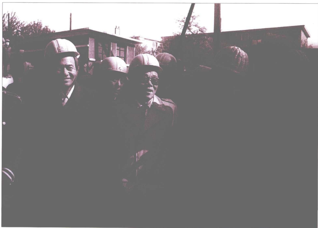
1987年5月，李瑞环同志视察住房改造工程