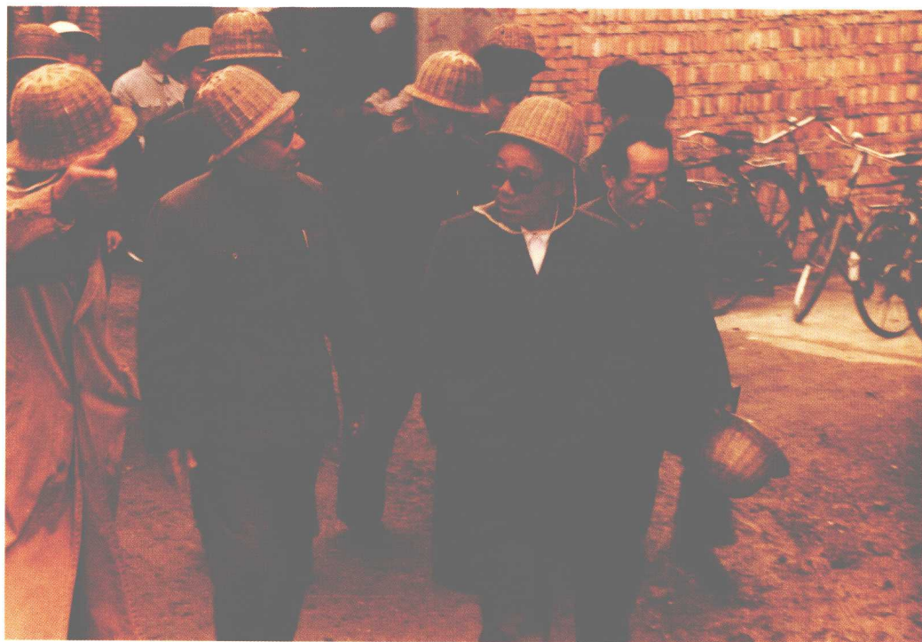
1985年李瑞环同志视察八里台立交桥工地