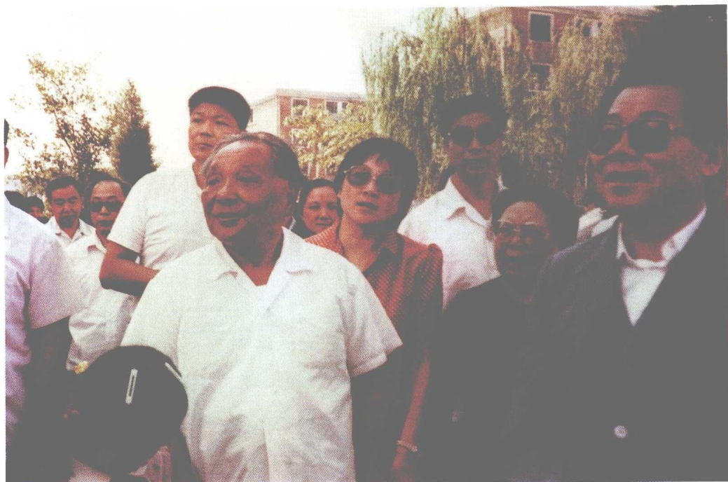
1986年8月20日，邓小平同志视察天津市河西区新建成的体院北居民区，李瑞环同志陪同