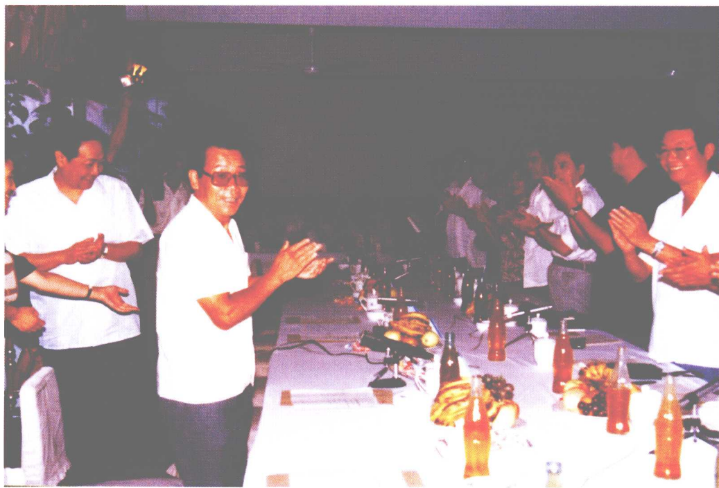
1988年教师节前夕，李瑞环同志与全市教师代表座谈，共商天津教育发展大计，并向全市教师祝贺节日