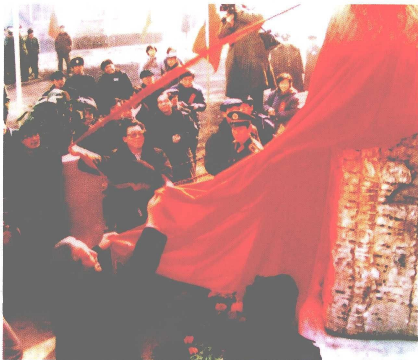
李瑞环同志为北洋工房改造工程竣工题写“北洋新里”的碑名并揭牌