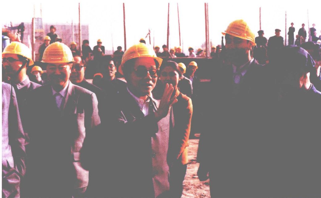
1987年5月，李瑞环同志视察河西区教师村工程