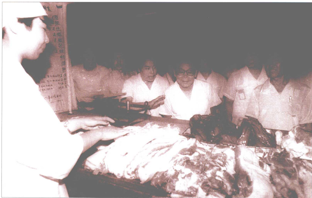
1988年7月，李瑞环同志考察市场供应情况