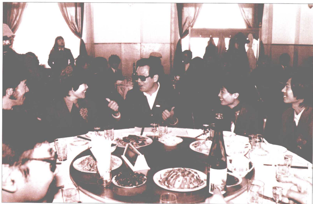
1988年11月16日，李瑞环同志参加大港油田百对青年集体婚礼