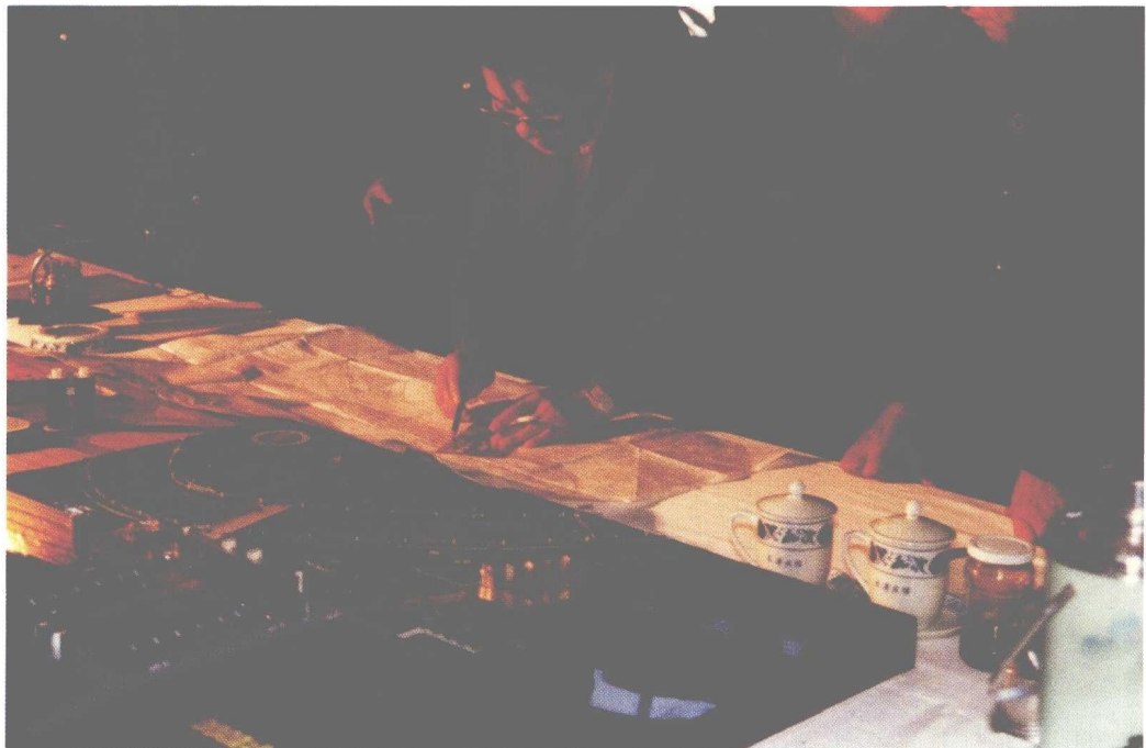
1987年李瑞环同志审查天津站工程设计