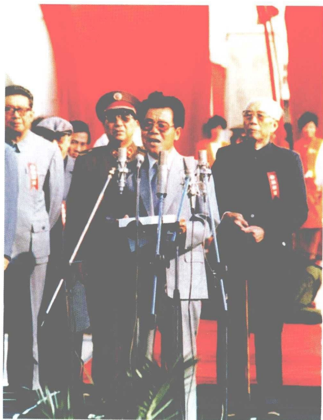
1987年10月1日 上午，李瑞环同志与 党政军领导和一万五 千名建设者共同庆祝 外环线道路工程竣工