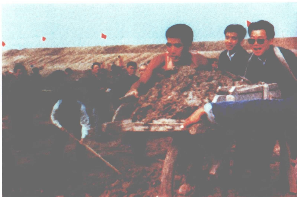
李瑞环同志参加引滦入津工程明渠开挖义务劳动