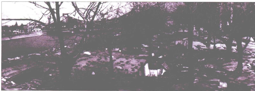
昔日海河岸边地震棚