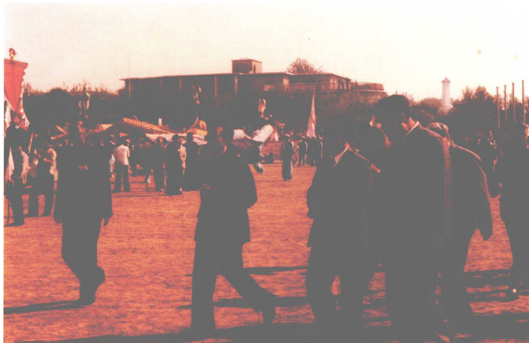
1984年10月1日，李瑞环同志在水上公园与广大群众联欢