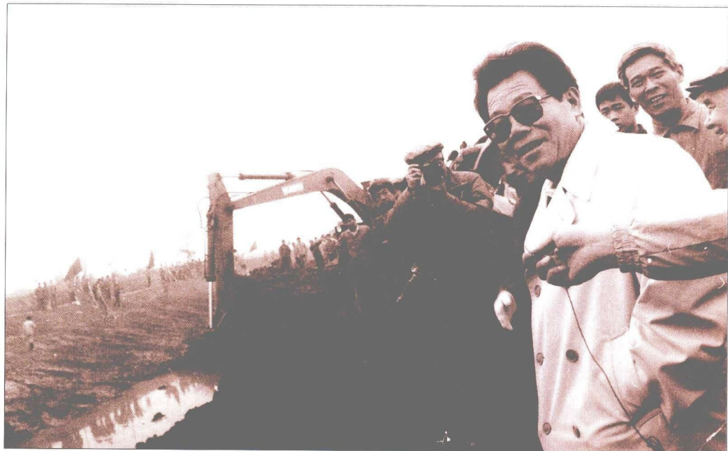
李瑞环同志在外环线建设工地