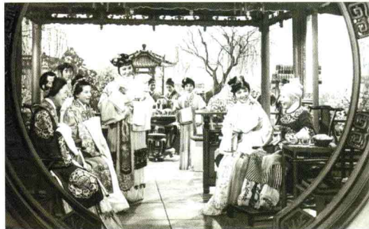
《红楼梦》 越剧 1978年出版

王别姬》还获最佳摄影提名。新世纪之初由海峡两岸中国电影人拍摄的《卧虎藏龙》一举夺得奥斯卡四项大奖，中国电影再次震惊了世界。