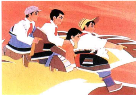
《金色的大雁》 动画片 1979年出版

在新中国社会主义建设时期拍摄的电影也曾激励过千百万有作为的青年男女，他们为祖国贡献了青春和力量，以这些影片改编的电影连环画证明了当时的历史。