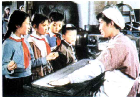
《一只铅笔》 科教片 1979年出版