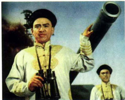
《甲午风云》 故事片 1963年出版