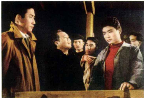
《青年鲁班》 故事片 1965年出版