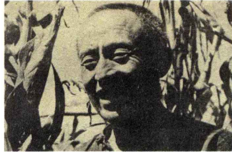
《庄稼人翻身》 纪录片 1947年出版