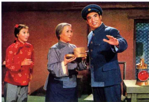
《红灯记》 京剧 1971年出版