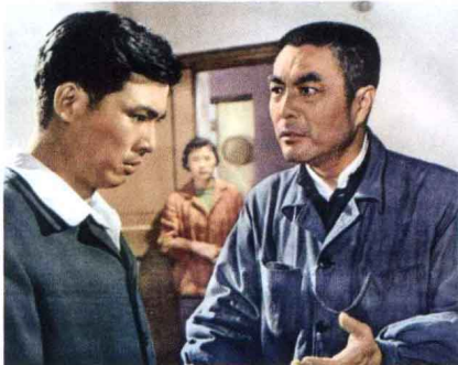
《千万不要忘记》 故事片 1965年出版