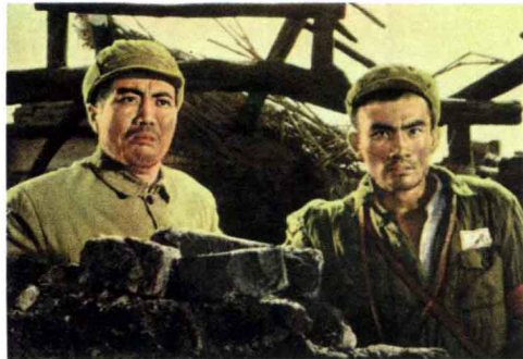
《红日》 故事片 1964年出版

文革后根据戏曲片编制的电影连环画很多，如《红楼梦》（越剧）、《铡美案》（京剧）、《女附马》（黄梅戏）、《西施》（昆剧）、《九松亭》（闽剧）、《花烛夜》（曲剧）、《双狮图》（婺剧）、《望夫云》（白剧），《孟丽君》（祁剧）、《逼婚记》（吕剧）、《三滴血》（秦腔）等等。