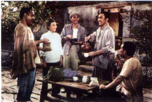
《朝阳沟》 故事片 1964年出版