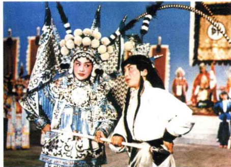
《杨门女将》 京剧 1960年出版

了连环画，例如《爱德华大夫》、《百万英镑》、《乱世佳人》、《马戏团》、《淘金记》、《舞台生涯》、《巴黎圣母院》、《沉默的人》、《佐罗》、《父子情深》、《英俊少年》、《卡桑德拉大桥》、《蛇》、《海狼》、《远山的呼唤》、《海峡》、《流浪者》、《冷酷的心》、《叶塞尼亚》等。既弥补了当年没引进的遗憾，又让读者了解了当时世界电影的状况。