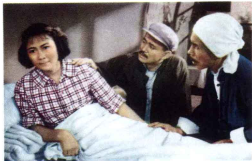
《我们村里的年轻人》 故事片 1964年出版

解放后电影业迈入新阶段，电影的质量、数量都空前提高。党和政府也很重视电影连环画的编辑出版，文革前的很多国产电影被制成了连环画，比如《钢铁战士》、《铁道游击队》、《雷锋》、《早春二月》、《刘三姐》、《龙须沟》、《女篮五号》、《林则徐》、《李双双》、《枯木逢春》、《花儿朵朵》等等，使这一时期的优秀影片以另一种形式流传。