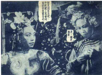
《清宫秘史》 故事片 1948年出版