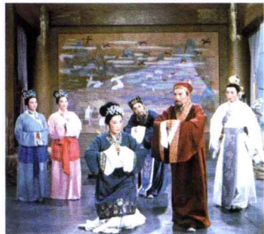
《蔡文姬》 话剧 1979年出版

电影连环画要少一些。难能可贵的是文革中有几本科教影片连环画出版，如《泥泥石流》、《毛竹》、《对虾》、《台风》等，文革后又有《一支铅笔》、《熊猫》、《草蛉》、《美国白蛾》等，文革前的不多见。