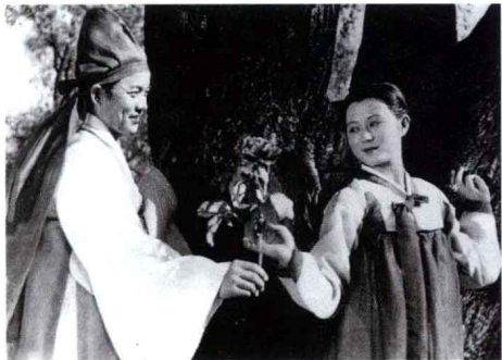
《春香传》 朝鲜影片 1981年出版