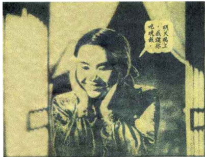
《玫瑰花开》 故事片 1938年出版