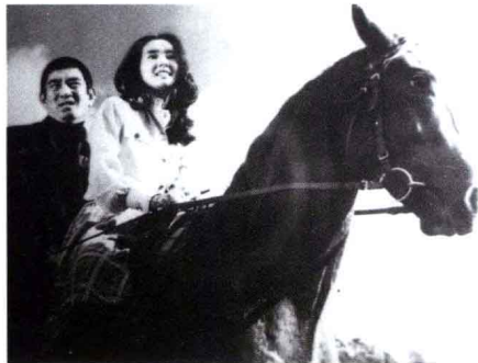
《追捕》 日本影片 1981年出版