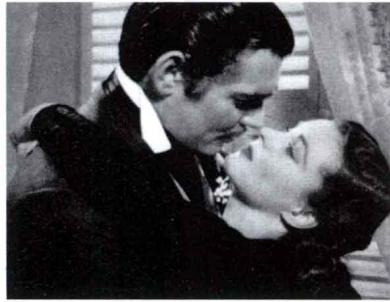
《乱世佳人》 美国影片 1988年出版

京剧谭派艺术的创始人谭鑫培，中国第一部电影诞生了。8年后的1913年，由我国电影人郑正秋编导的中国第一部故事片《难夫难妻》问世，以后又有《新女性》、《小玩意》、《神女》、《渔光曲》等优秀默片出品。1931年中国第一部有声片《歌女红牡丹》诞生后，又涌现出《风云儿女》、《大路》、《桃李劫》、《一江春水向东流》等优秀影片。《渔光曲》曾在1935年的莫斯科国际电影节上获“特别荣誉奖”，而《风云儿女》中的主题歌《义勇军进行曲》后来成为中华人民共和国国歌。我国第一部彩色故事片《生死恨》于1948年问世。