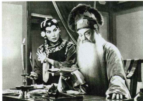
《宋士杰》 京剧 1957年出版