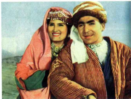
《冰山上的来客》 故事片 1964年出版