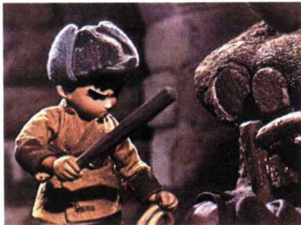
《半夜鸡叫》 木偶片 1970年出版