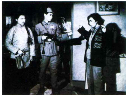
《铁道卫士》 故事片 1972年出版

我国的电影连环画诞生于20世纪20年代初，1921年，上海的中国影戏研究社以当时洋行买办阎瑞生图财害命勒死妓女王莲英的谋杀案件的剧情，拍摄了被称为第一批长故事片之一的《阎瑞生》。此片情节虽然十分恶劣，却投合了一部分落后小市民的低级趣味，骗得了不少观众。中国影戏研究社是洋行买办几个人成立的，不懂电影，所以该片编剧是请商务印书馆机要科的杨小仲来完成的，影片也是请商务印书馆代摄、代洗、代印的。为了多牟利，他们又请商务印书馆印制了一种印刷品用以宣传，该印刷品选影片《阎瑞生》20幅剧照，每幅下