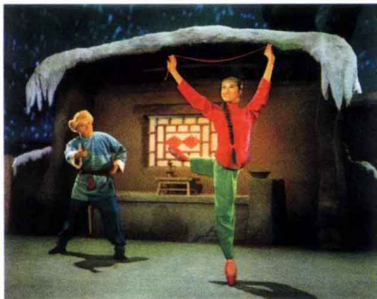
《白毛女》 芭蕾舞剧 1973年出版