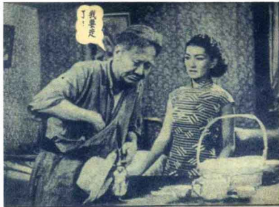
《吸血鬼》 故事片 1950年出版