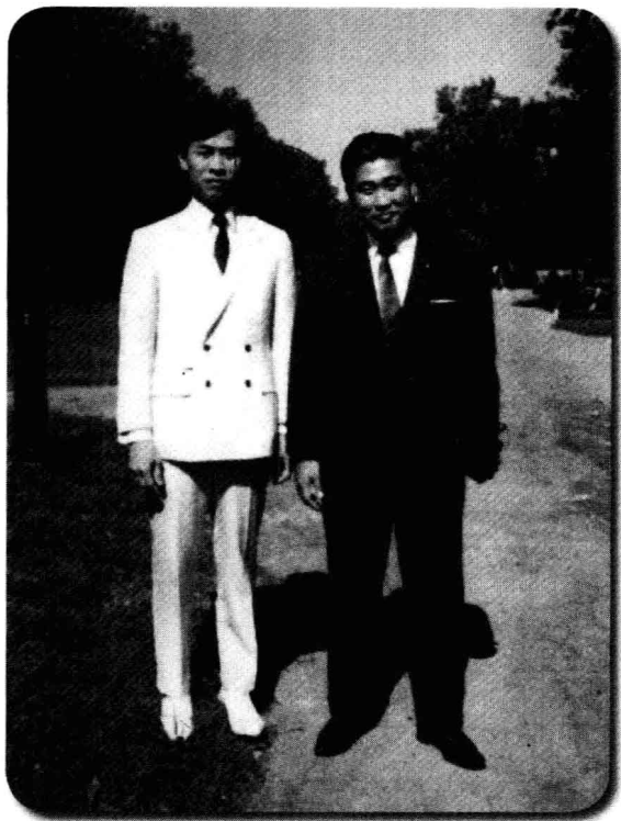
1967年小淵惠三訪問紐約時與陳鵬仁合照。