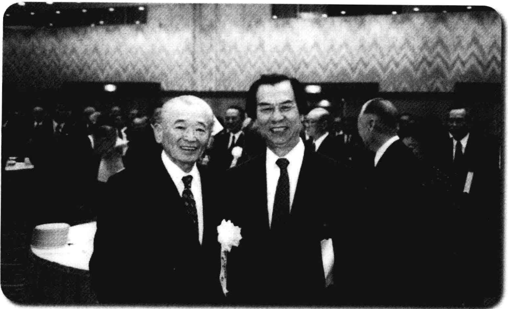
陳鵬仁先生與日本前首相竹下登先生合影。1998年。