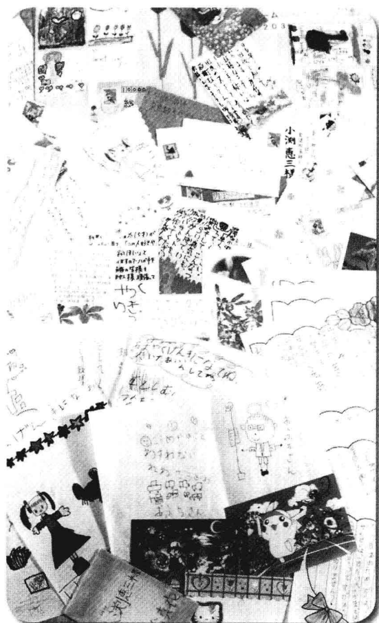
日本全國中小學生寫給小淵首相的慰問信