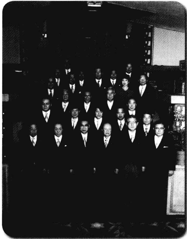
1988 年 7 月 30 日第一次小淵內閣全體閣員