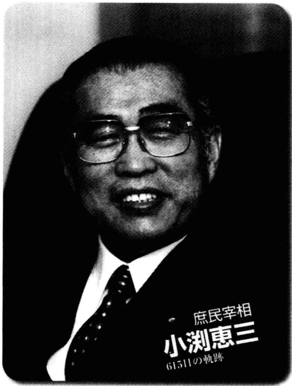
前日本首相小淵惠三