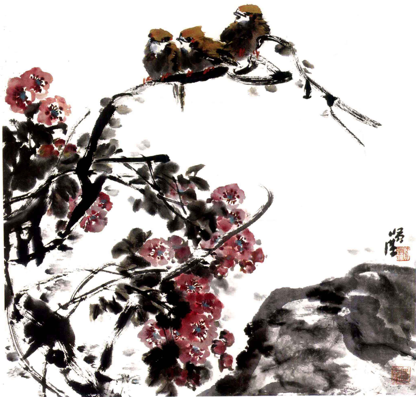
喜上眉梢 纸本设色 98cm x 98cm 2006