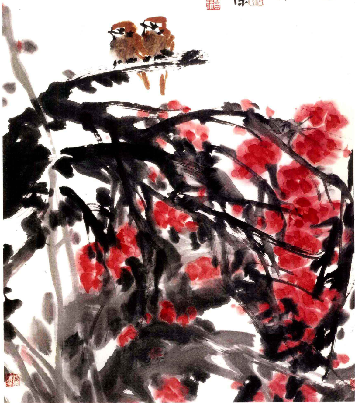
春信 纸本设色 98cm × 68cm 2006