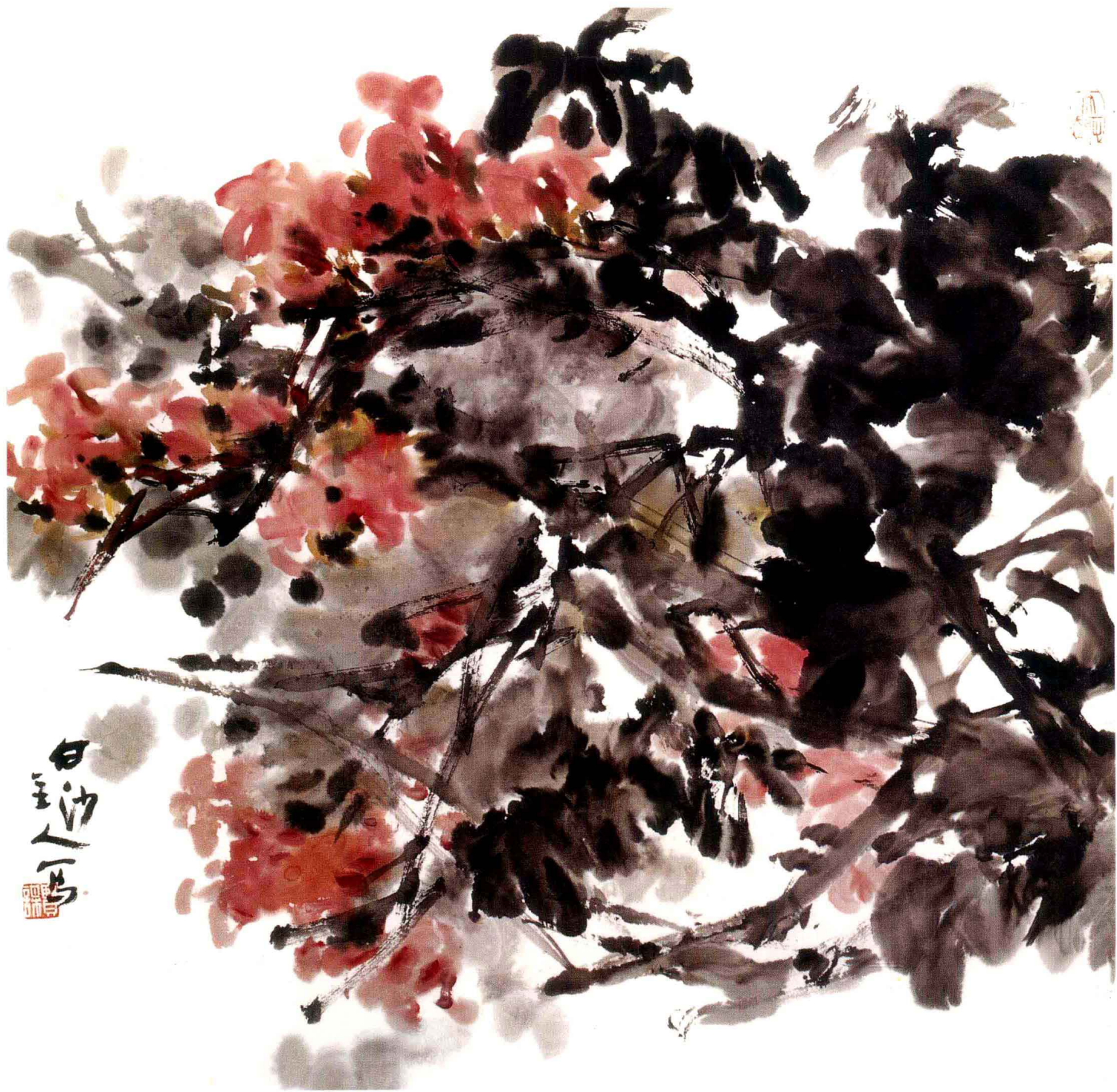
秋风骤起 纸本设色 98cm × 98cm 1988