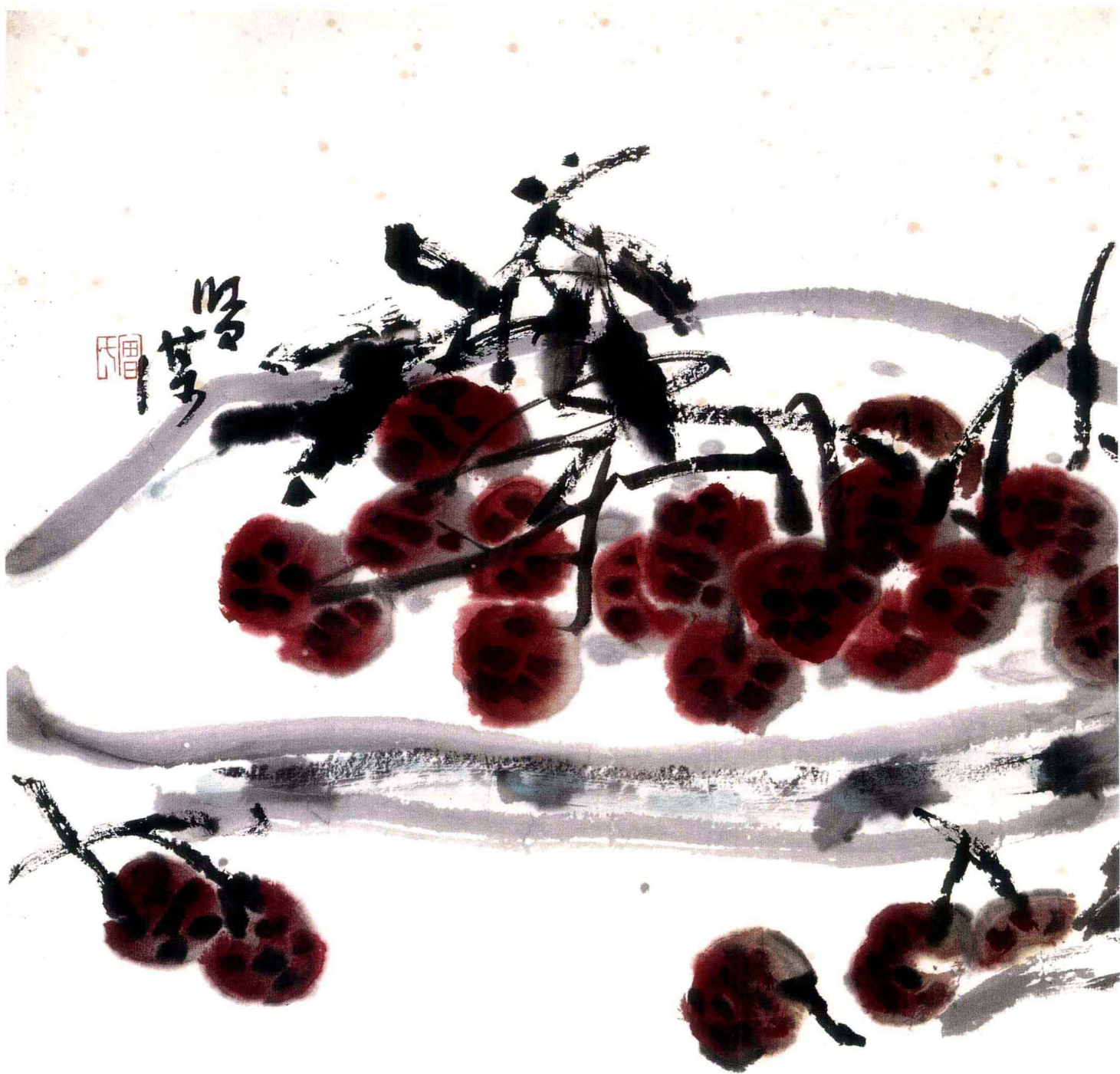
荔枝 纸本设色 98cm × 98cm 2006