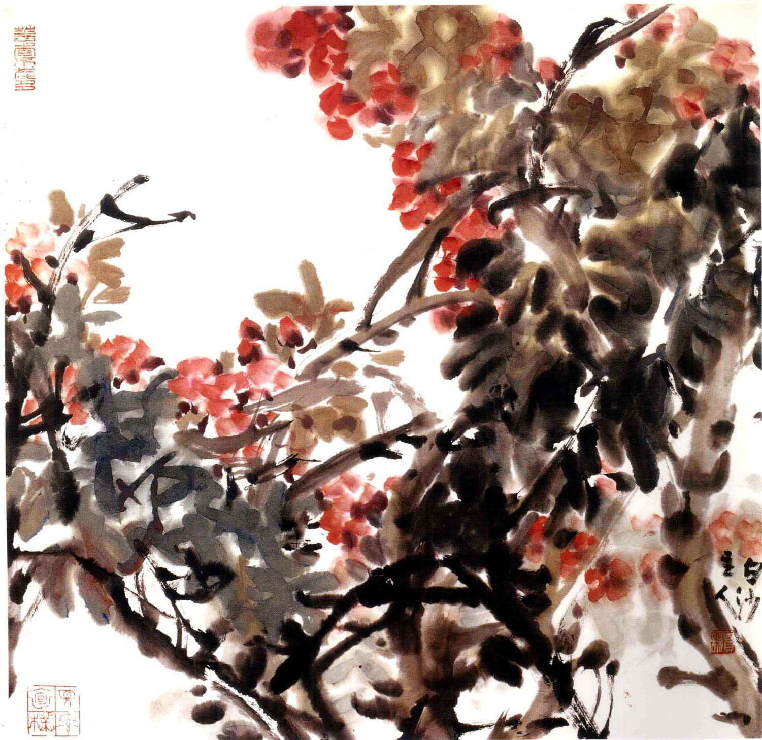
春花如烟 纸本设色 68cm × 68cm 1999