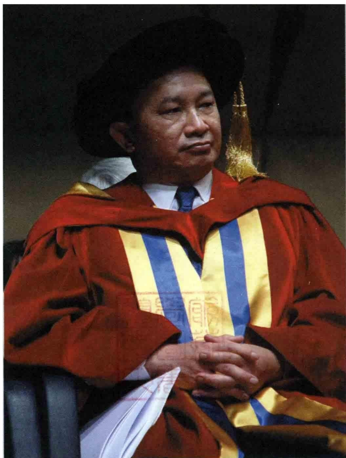
吳宇森在香港浸會大學的榮譽博士頒贈典禮上。