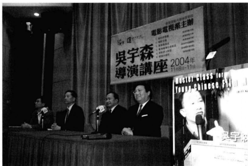
卓伯棠、吳清輝校長、吳宇森博士、何志平局長。（由左至右）

在吳宇森回香港前的兩個多月，我們已預先將四天的講座時間安排好，而且向前來參加講座的中國、台灣、新加坡及澳門的院校發出了邀請函，學生收到函件後即各自辦理來香港的手續。講座是上午、下午以及兩個晚上都有安排，中間有兩樁事是臨時加上的：一，當時的特首董建華邀請吳宇森一聚，時間約一小時；二，香港電影工作者聯合會總會的岑建勳來電，請吳抽空為「影視職藝人員培訓班」主持開幕典禮。兩件事安排好後，即給吳宇森去信確定，在信中我提到幾天的講座排得密密的，他會很累，抱歉地問他是否減少一、兩個講座，或者將講座的時間縮短些？怎知接到他的回信卻是：「一切按已有日程表進行，講座一個也不要少，時間也不要縮短，我會全力配合，不作宣傳，因為不是來作影片宣傳，『務實』一點比較