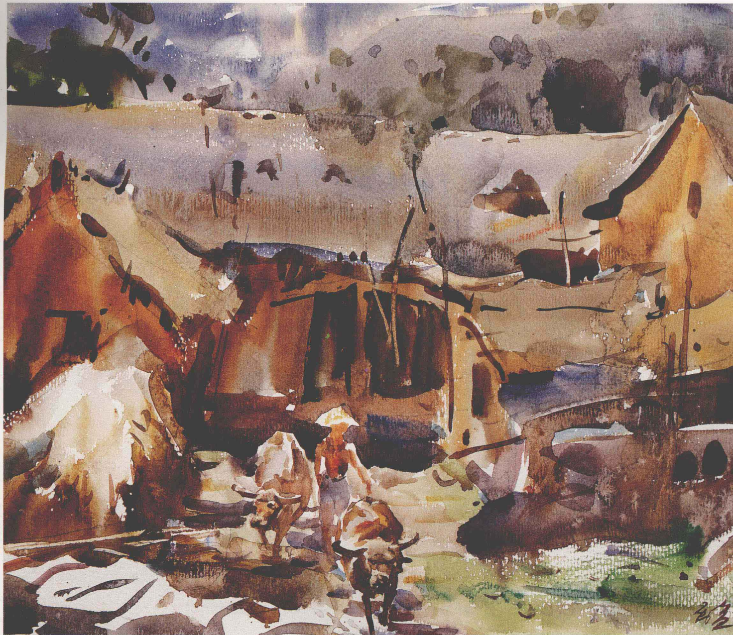
王 宣 湘西寫生 (33×44cm) Wang Xuan Sketching in Western Hunan