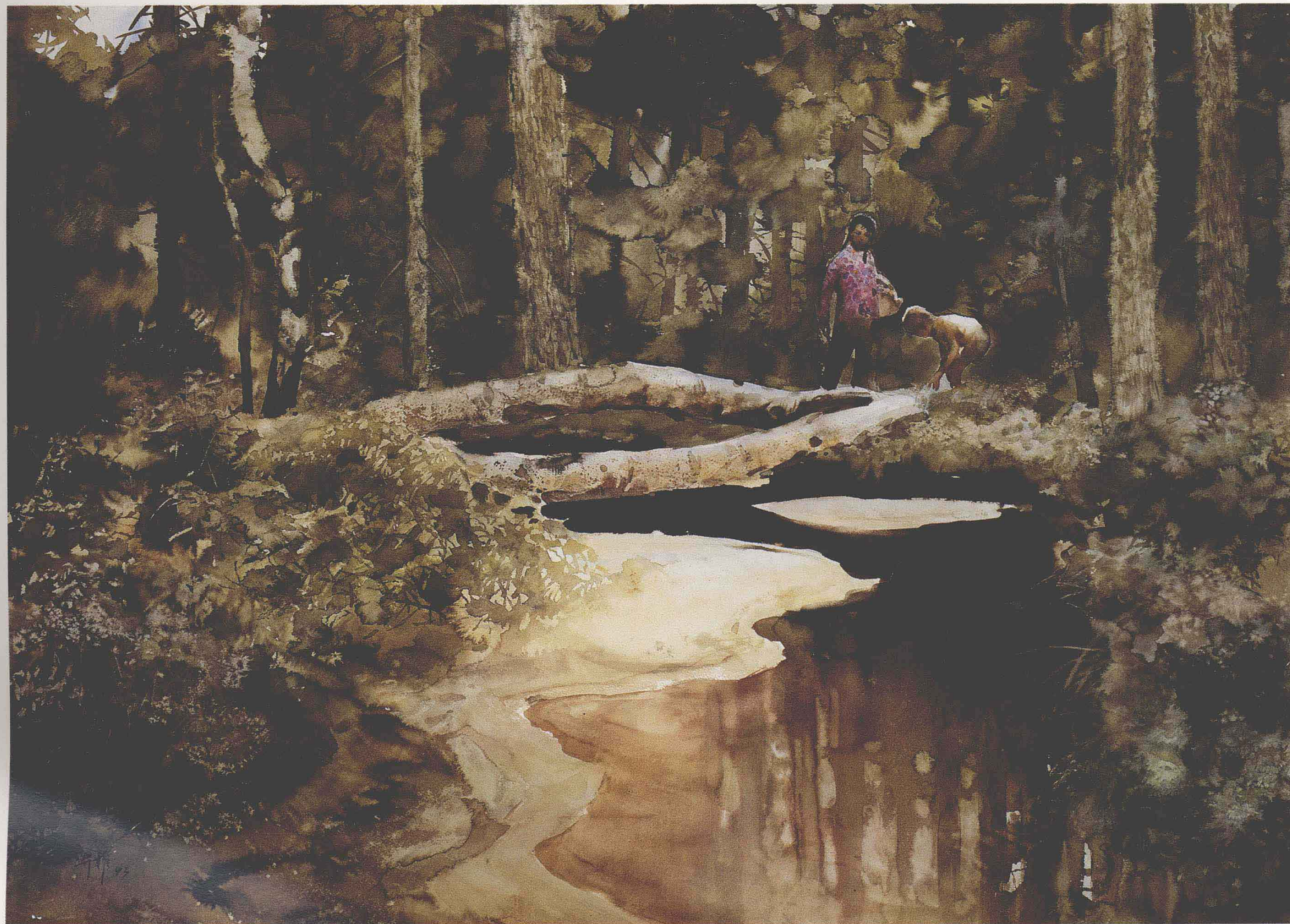
李升權 采 (76.6×105.6cm) Li Shengquan Collecting Mushrooms