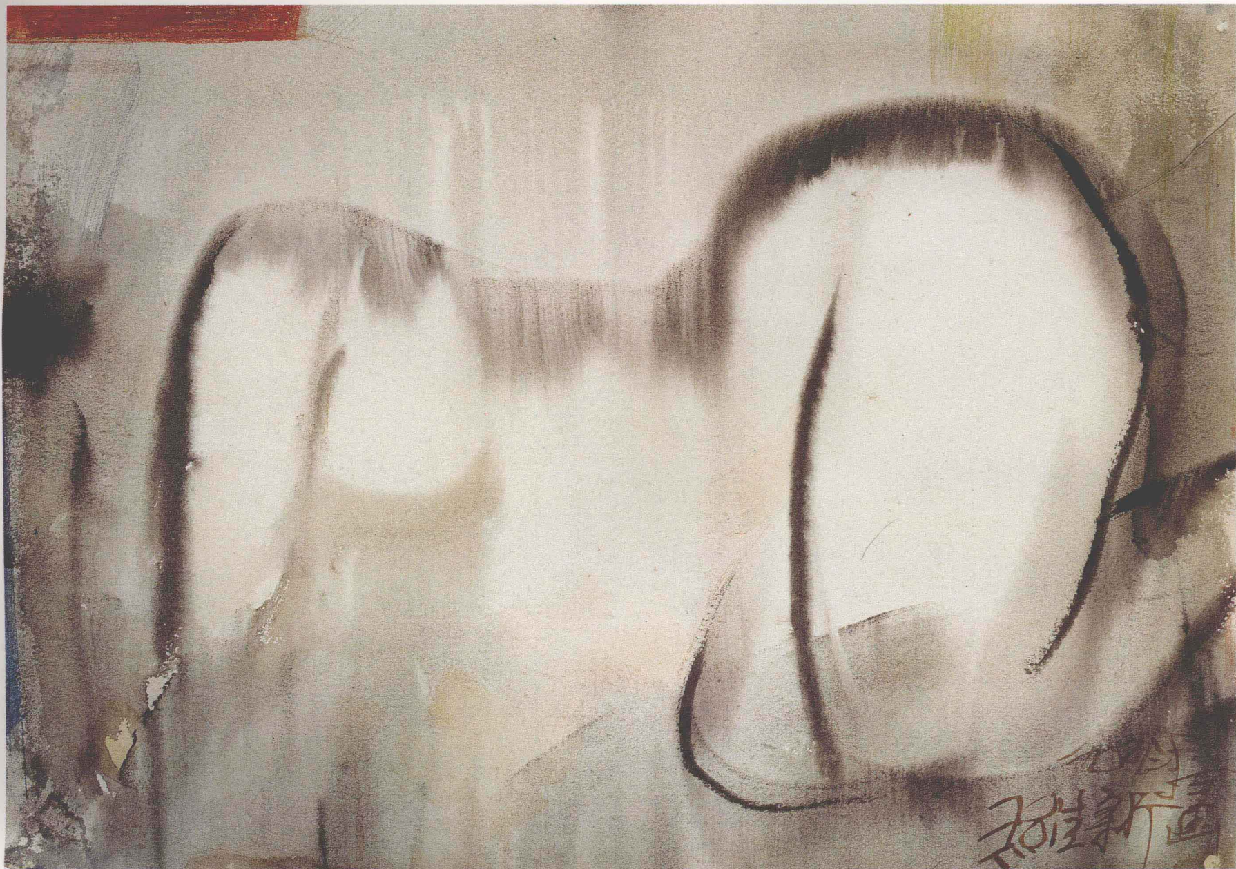
王維新 女人體 (54×76cm) Wang Weixin Human Body