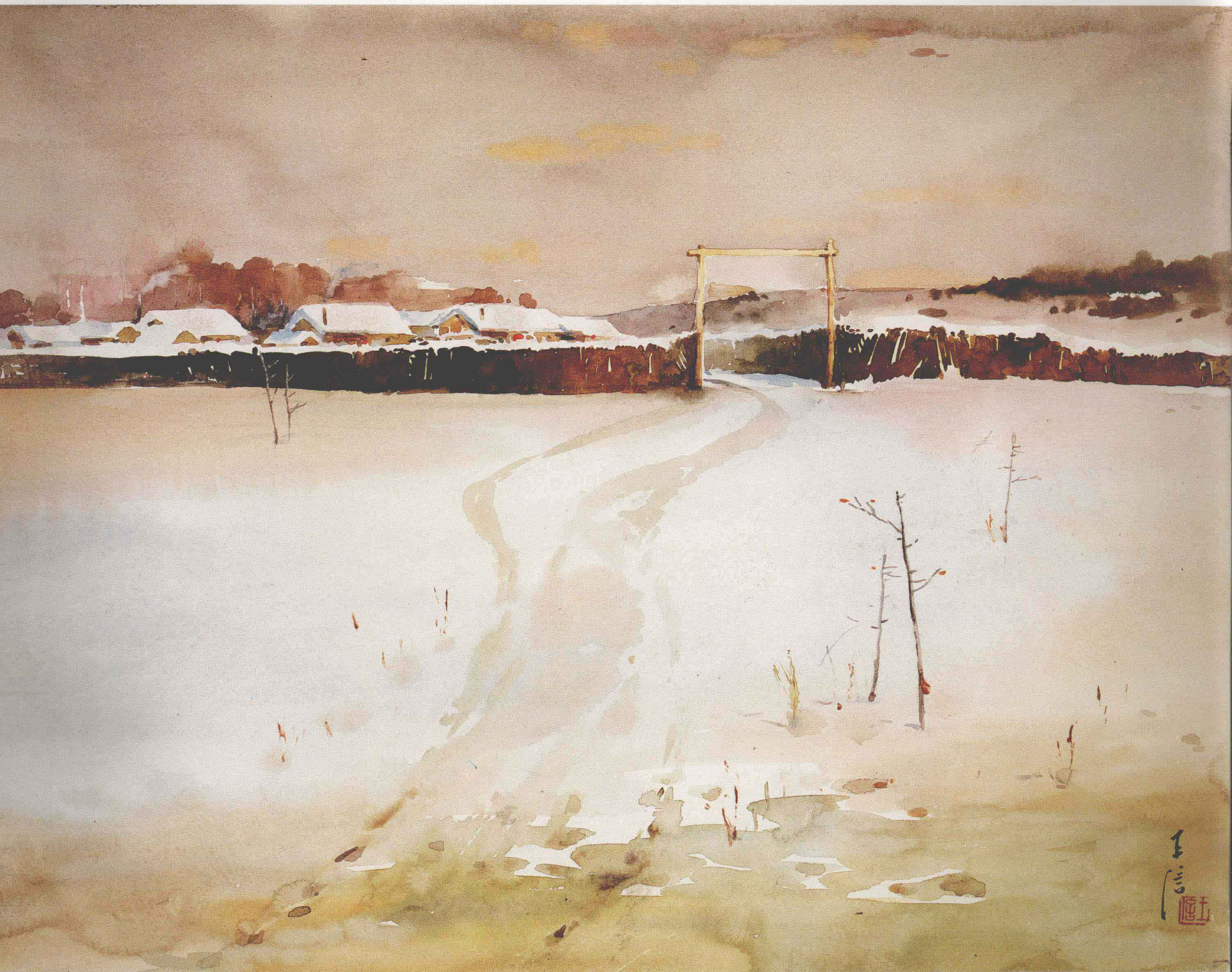
王 信 最北的邨落 (38.5×53.4cm) Wang Xin Northernmost Village