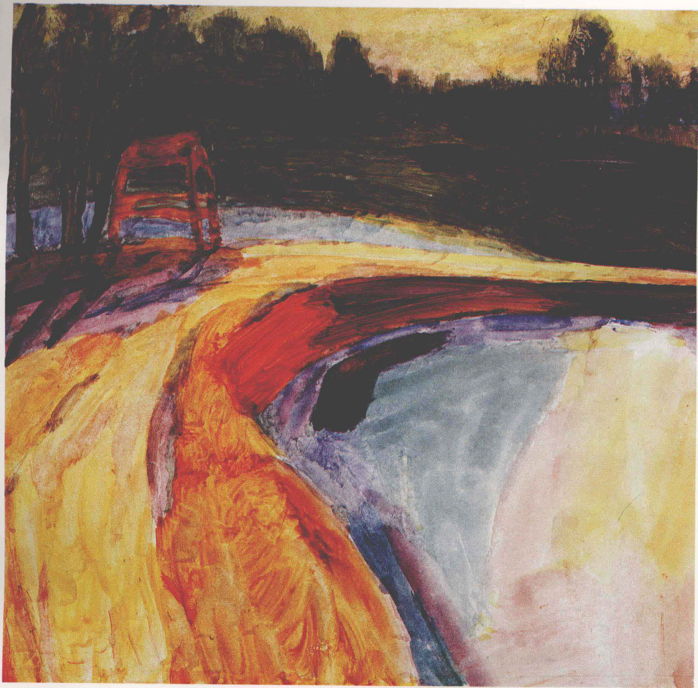
石宏建 道 (26×26.3cm) Shi Hongjian Road