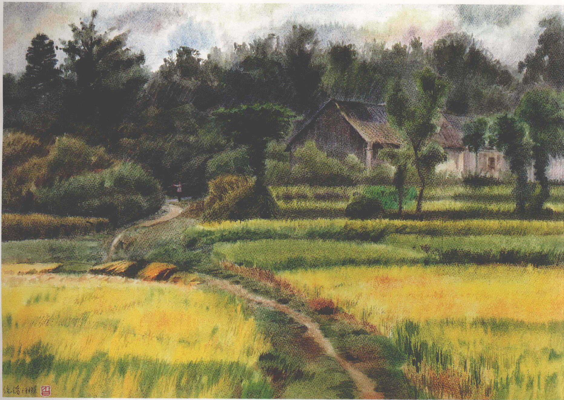
白統緒 江漢邨頭 (53×79cm) Bai Tongxu A Village on Jiangnan Plains