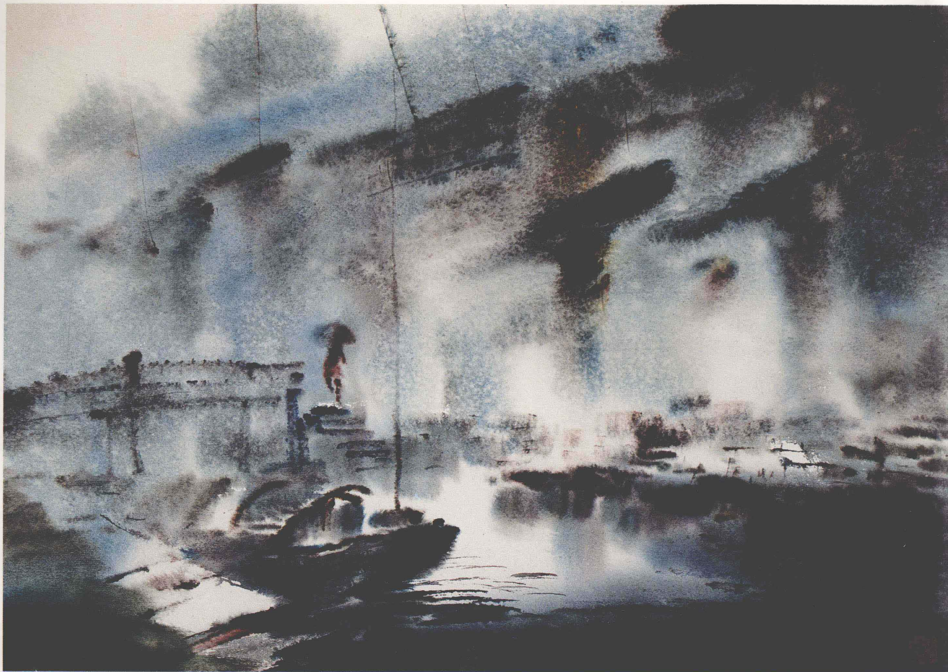
王雲鶴 水鄉紹興 (45.2×63.5cm) Wang Yunhe Water Country Shaoxing