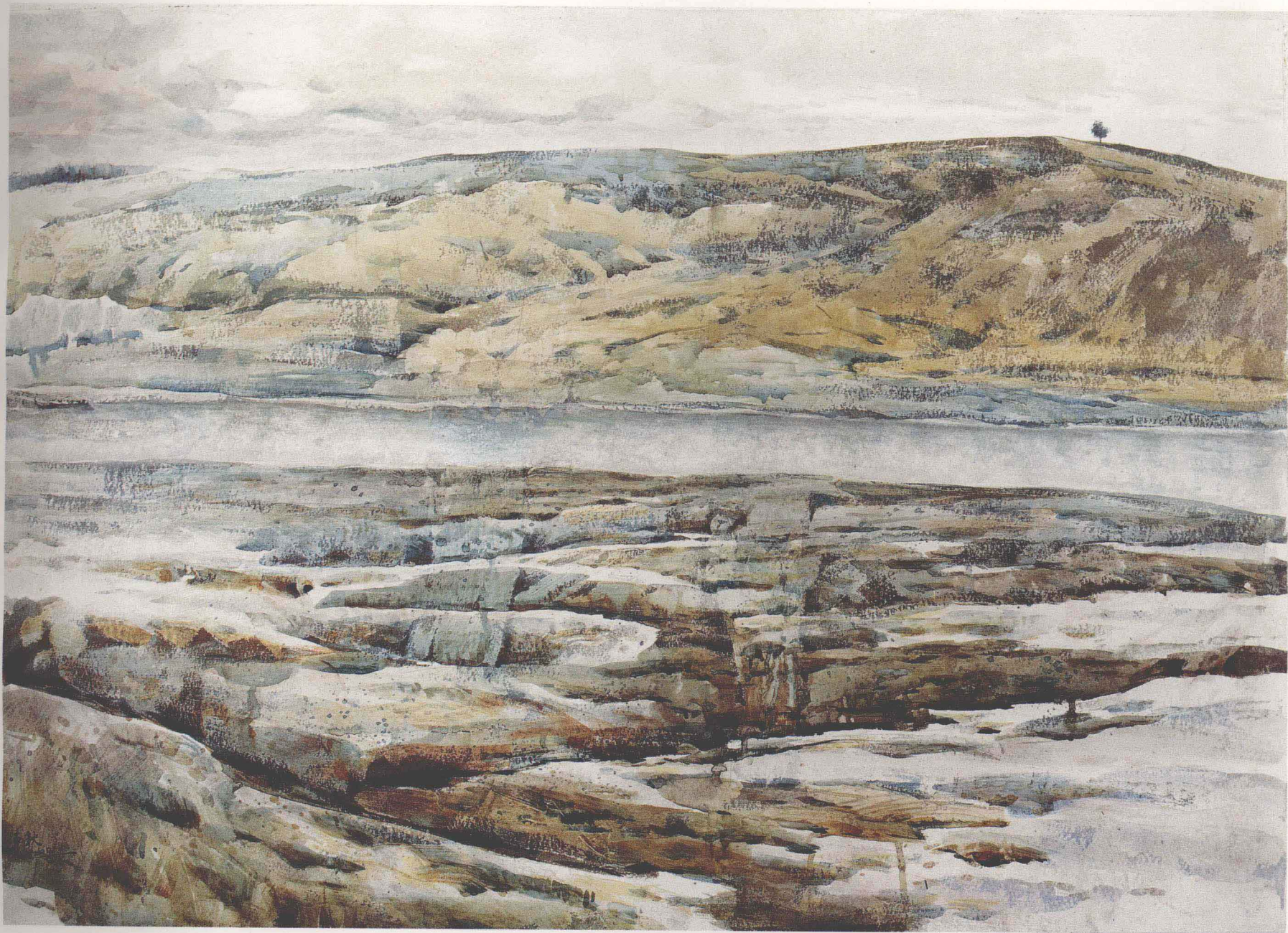
李平秋 原上初雪 (58×82cm) Li Pingqiu First Snow on the Highland