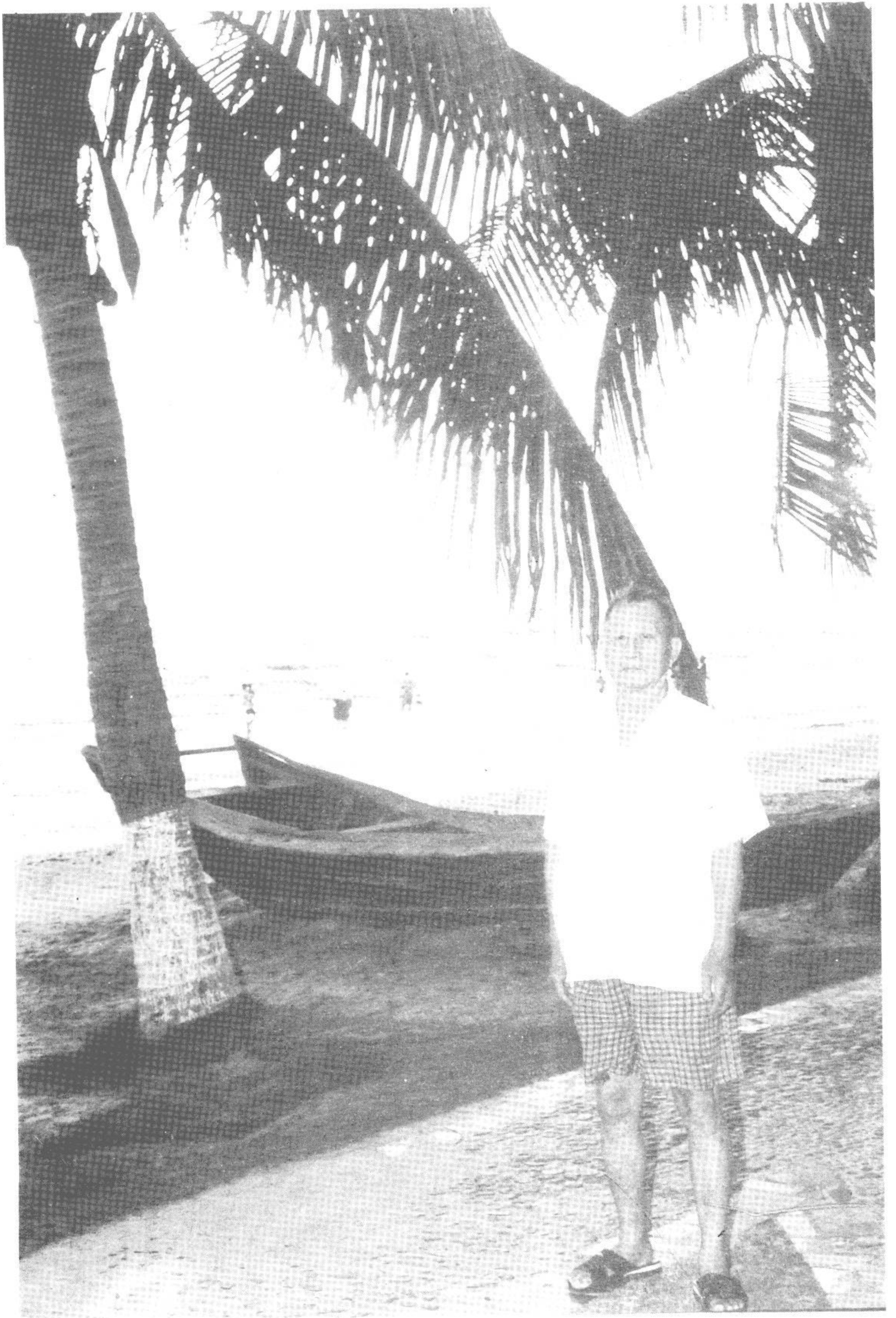
三亚湾 甲申夏6月