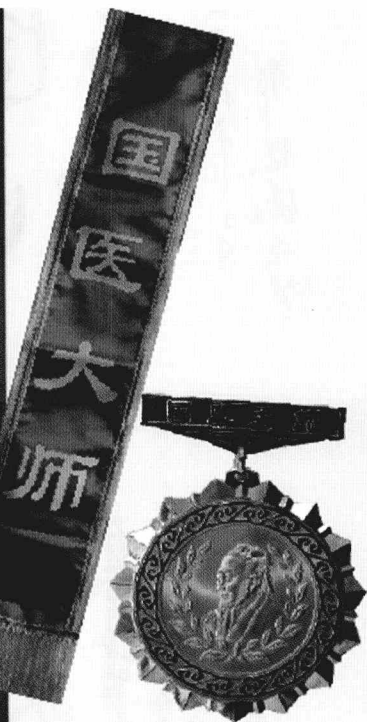
颜正华教授2009年获国家国医大师荣誉称号