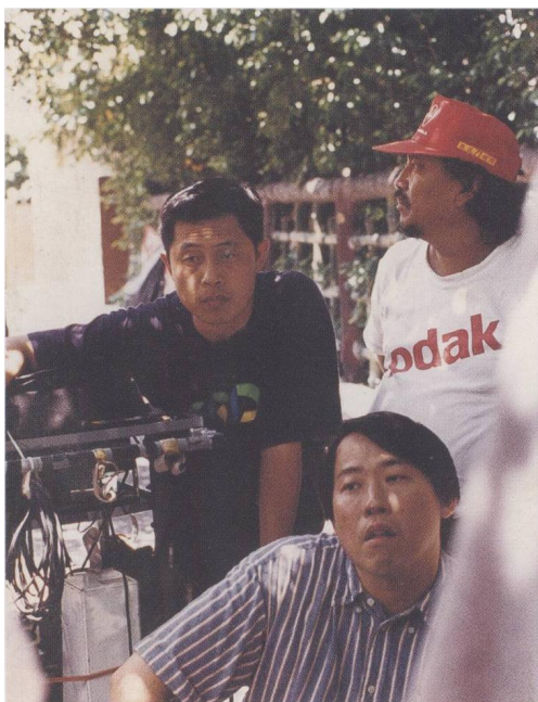
下：《國道封閉》（1997）拍攝 現場。