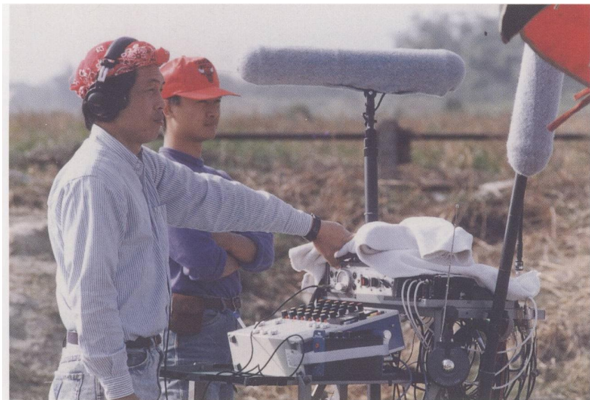
《少年吔，安啦》（1992）拍攝現場，照片杜篤之提供。