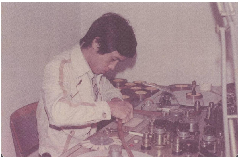
《英烈千秋》（1974）的槍砲音效製作，照片杜篤之提供。