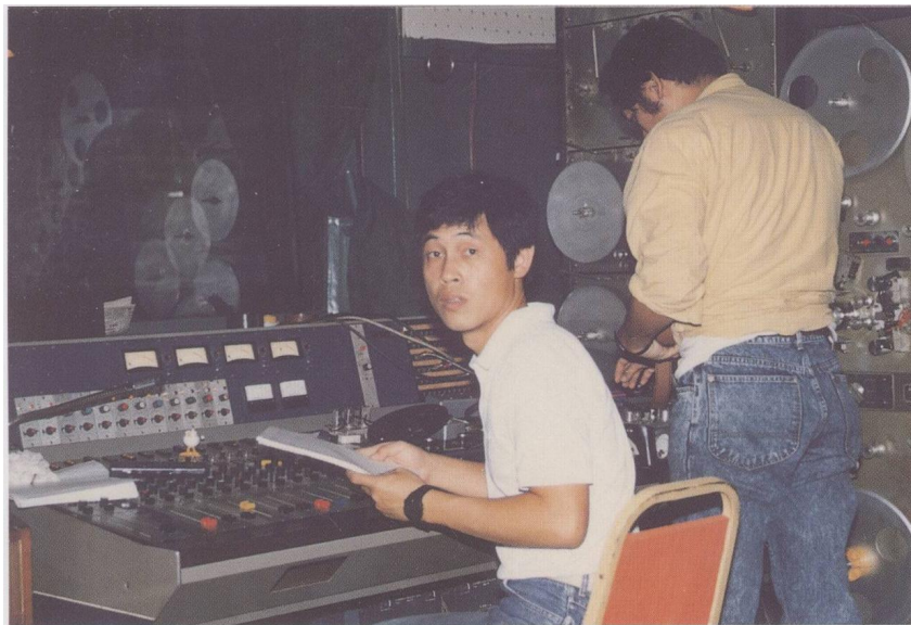
早期於中影錄音室。