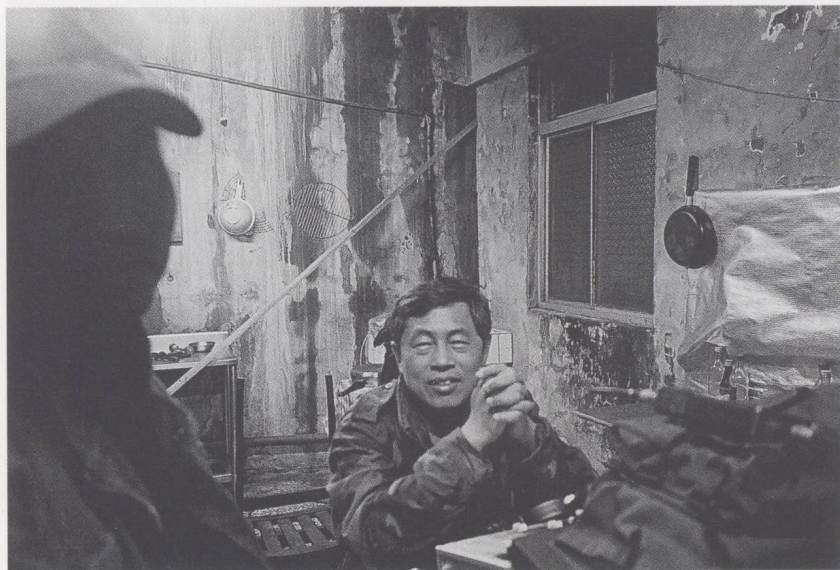
《好男好女》（1995）拍攝現場。