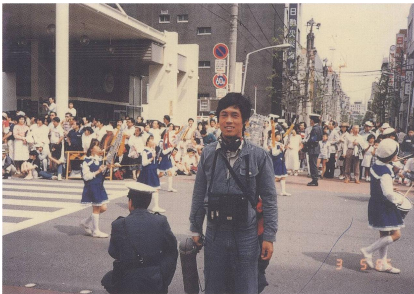
《我這樣過一生》（1985）於日本橫濱遊行收音，後來音效用於《聽說》（2009），照片杜篤之提供。