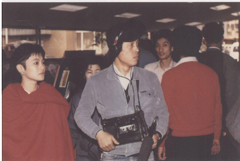
張艾嘉《忙與盲》專輯（1999）音樂及音效設計，照片杜篤之提供。