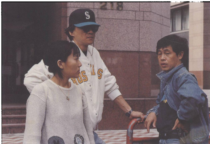
《麻將》（1996）拍攝現場，照片杜篤之提供。