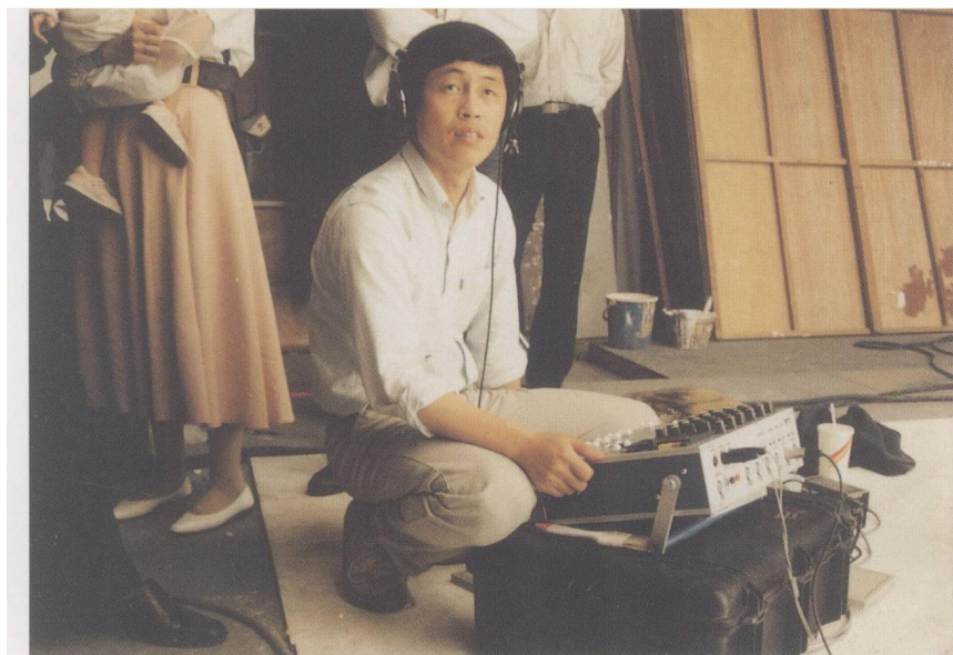
《好男好女》（1995）拍攝現場。