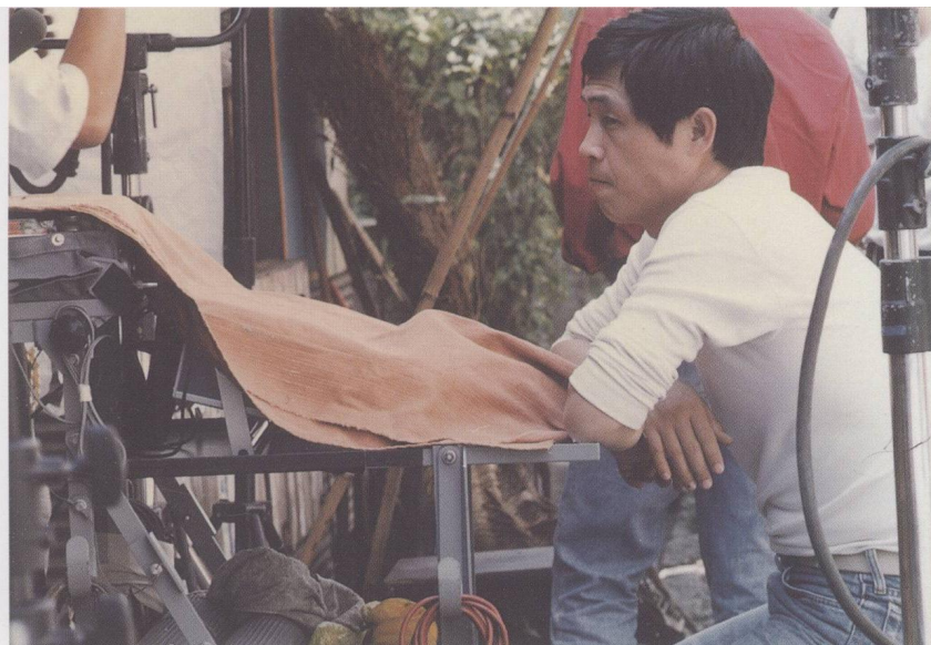
早期現場收音。