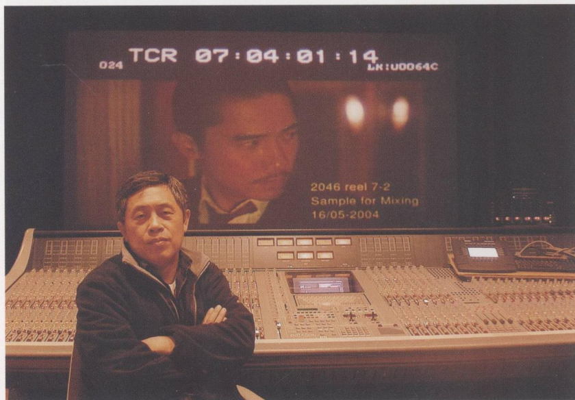
《2046》（2004）於泰國錄音室。