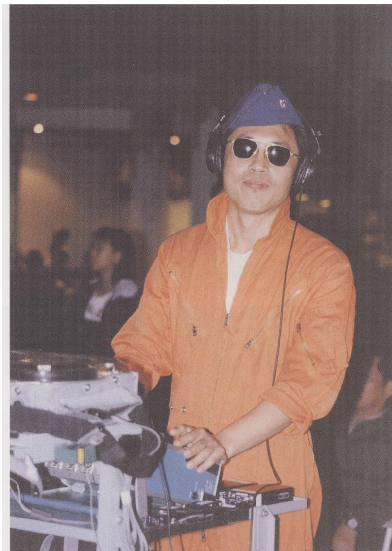
《牯嶺街少年殺人事件》（1991）拍攝現場，應導演楊德昌要求穿上空軍制服拍照，照片杜篤之提供。