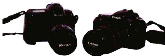
图 2-1-1 常见的数码单反相机