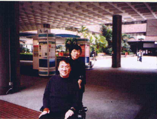
张妈妈陪伴儿子在国内、在国外