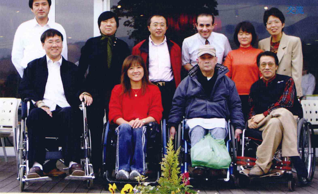
与来自世界各地的朋友交流心路历程。