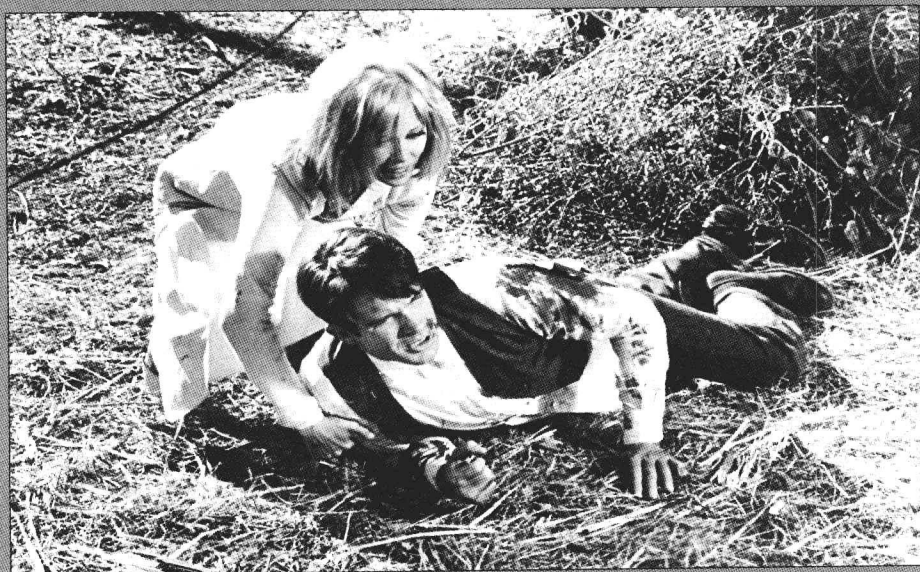
《邦妮和克莱德》(Bonnie and Clyde, 1967)