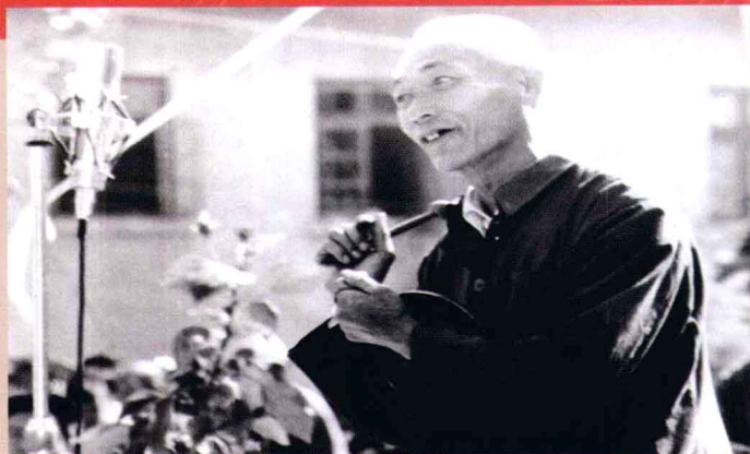
著名山歌手刘承达，1958年7月，出席全国民间文学工作大会，受到毛泽东主席等中央领导的亲切接见，1962年参加全国民歌调演，获优秀歌手奖。

兴国山歌生动活泼，形式多样，生活气息浓郁，有独唱、对唱、三打铁、联唱、轮唱，有锁歌、盘歌、斗歌、猜花、丢观音、黄鳝咬尾、绣搭链、藤缠树、树缠藤等等，就大的表演形式来分，大体有山野田间唱和、跳覘、民俗歌、叙事山歌、赛歌、舞台化的新山歌等种类。