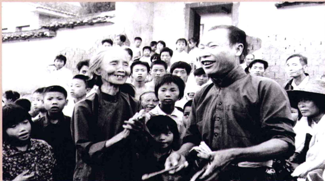
著名山歌手谢文棱与红色山歌大王曾子贞斗歌