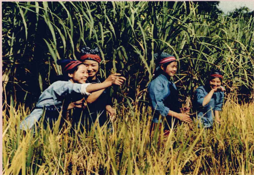
1955年，由姚荣滔、江洪涛撰稿，赣州电视台拍摄的音乐风光片《兴国山歌》获中宣部对外金桥铜奖。图为《兴国山歌》剧照

兴国县95%以上的人口均为中原南迁的客家人及其后裔。由于独特的地理环境和客籍背景，世代居住在山林中的客家人在艰辛的生活劳作之余，他们只有用山歌来抒发内心的情感。中原的古风遗韵和当地土著文化