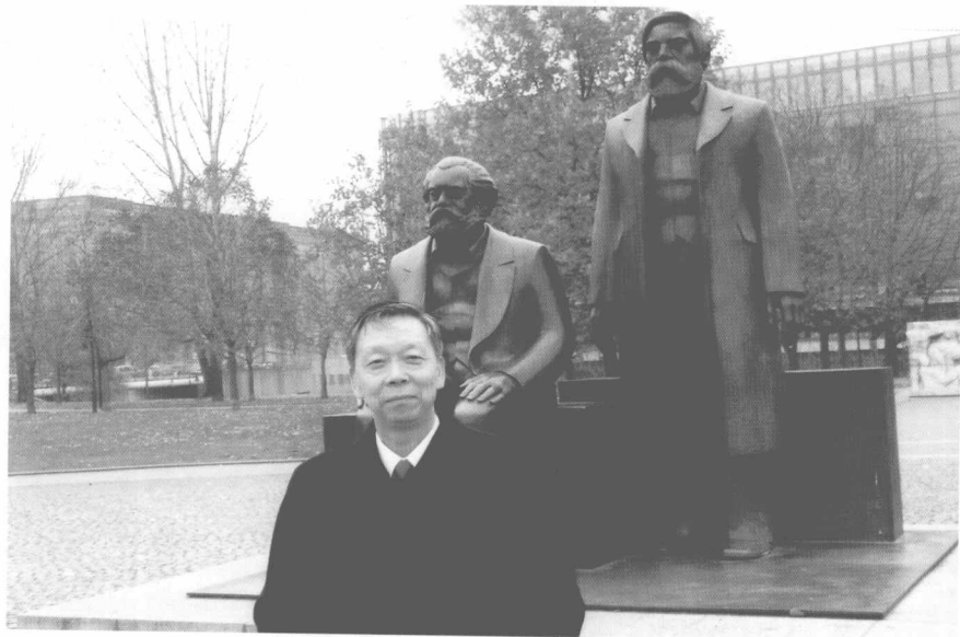
在马克思、恩格斯像前