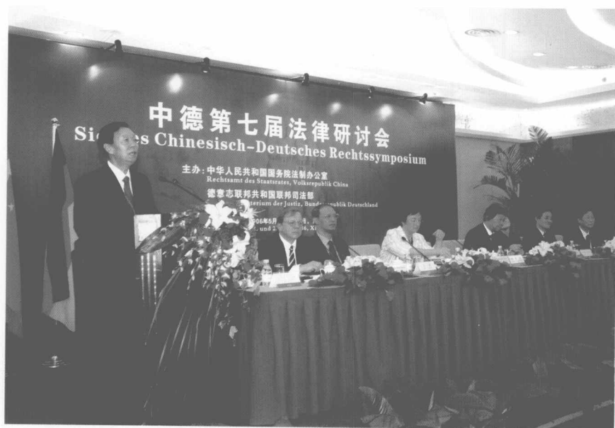
在中德法治国家对话第七届法律研讨会上致开幕辞