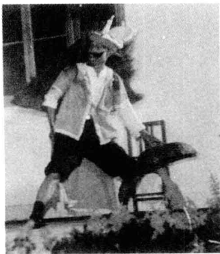
□ 中国苗族蚩尤戏 苗区有一种“恰相”（汉语即赶伤亡鬼）的仪式，事先由苗巫装扮成蚩尤，头上倒戴生铁制作的三脚（炊具），面部涂黑锅烟灰，身穿红色法衣，右手握巫刀，左手持簸箕。然后表演蚩尤驱鬼的全过程。这是苗区延续至今的祭祀仪式剧。

相扑在中国古代被称为“角力”、“角抵”、“手搏”等，比较类似于今天的摔跤。它历史悠久，可以追溯到没有文字记载的远古。现今流传的故事——黄帝和蚩尤涿鹿之战中就隐隐提到了“角抵”。传说在4600多年前，黄帝的部落与蚩尤的部落在涿鹿（今河北涿鹿县）展开生死大战。蚩尤头部长着犄角，耳鬓仿佛剑戟，他用“角抵”之术对付黄帝，锐不可当。这个传说带着浓厚的神话色彩。然而却不难看出“角抵”一词最初带有的武力色彩。它显然起源于原始部落为了争夺地盘而进行的争斗。中国古代北方农村中还流行一种“蚩尤戏”。百姓们头戴牛角，三三两两互相抵斗。这种民