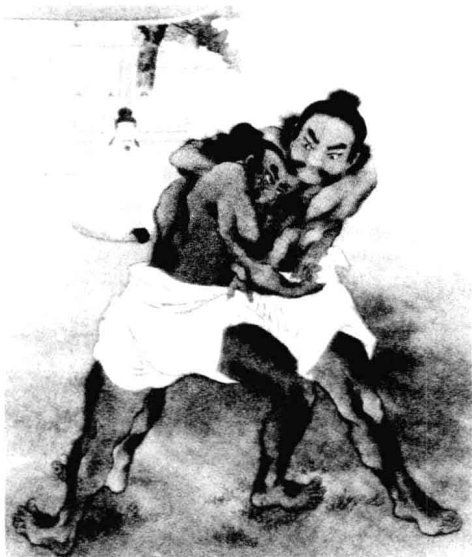
□ 相扑力士野见宿祢和当麻蹶速比武图

1700多年以前，神事相扑曾在日本民间风行。顾名思义，神事相扑指的是为了祭祀诸神而进行的力气较量。在当时百姓们心里，神事相