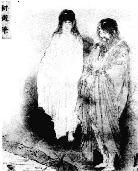
□ 《日本创世之神像》 图中所绘为日本神话中至关重要的两位创造之神。