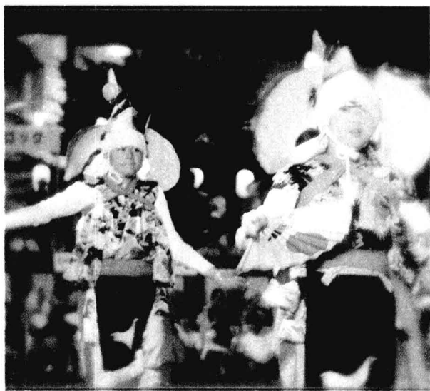
□ 日本当代祭祀活动 日本的祭祀活动很多，一年中每一个月份都有各种各样的祭祀活动在全国各地举行，男女老少，载歌载舞，场面十分热闹。

扑获胜者都是神的宠儿，可以给自己故乡带来丰裕和幸福。这种相扑当然被理所当然地视为“神的行事”，从而披上一层浓厚的宗教传奇色彩。那时候的相扑自然与神社佛阁脱不了关系，每当各地举行祭祀活动，总会进行相扑比赛。让我们不妨还原一下当时“祭谷神”的场面。装扮十分漂亮的牛一路行来，十分神气，只见牛背上驮着用金银装饰的花鞍，花鞍上面插着许多五颜六色的小旗，随风飘扬，在这些旗子衬托下，那牛仿佛成了童话里才有的“神牛”。当成堆的稻草被点燃后，四周便响起了人们虔诚的祈祷声和激昂的鼓乐声。成堆的稻草被点燃，聚拢在一起的人们开始祈祷，一时间祈祷声和鼓乐声响成一片。漫天火光中，只见“神牛”拉犁，姑娘们插秧。带着假面具装扮成各种“鬼神”的孩子们手舞足蹈，追逐玩乐。妇女们高梳头髻，佩戴花冠，身着和服，脚踏木屐，翩翩起舞。就在此