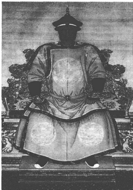
清太祖努尔哈赤画像