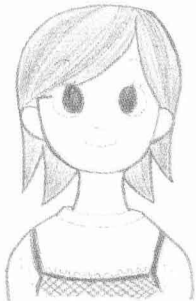
국적 : 일본 이름 : 유리