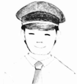
국적 : 한국 이름 : 유실물센터 직원