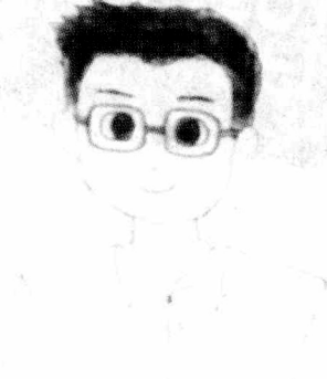
국적 : 한국 이름 : 맞벌이 남편