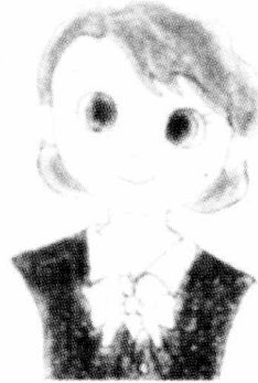
국적 : 한국 이름 : 맞벌이 아내