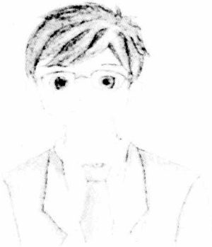
국적 : 한국 이름 : 서비스센터 직원