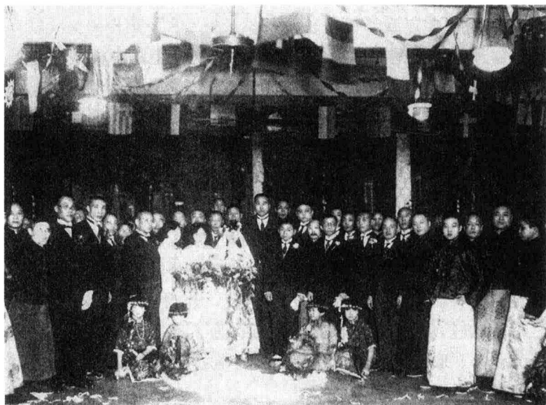
当时大户人家婚礼情景。

说得好不如来得巧，他的四女儿正巧拎着水壶进来续茶，在座几位老人的目光便不约而同地集中在了这待字闺中的少女身上。