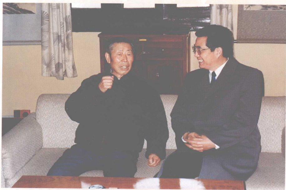
1993年12月18日，中共中央政治局常委胡锦涛同志（右一）到家里看望