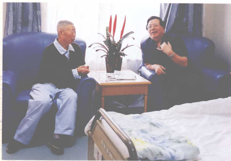
2003年7月7日，国家副主席曾庆红同志（右一）到北京医院看望时合影