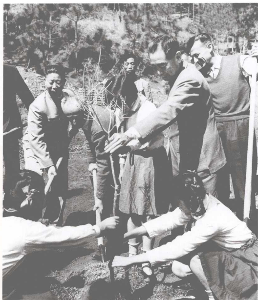
1964年3月3日，与周恩来总理（左四）、阿尔巴尼亚专家（左五）在昆明海口种植象征和平友谊的油橄榄树。