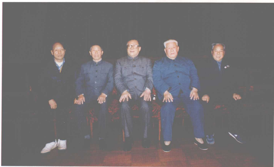
中共中央总书记江泽民同志在云南视察时与几位老同志合影。(从左至右：朱家璧、刘明辉、江泽民、马继孔、高治国同志)