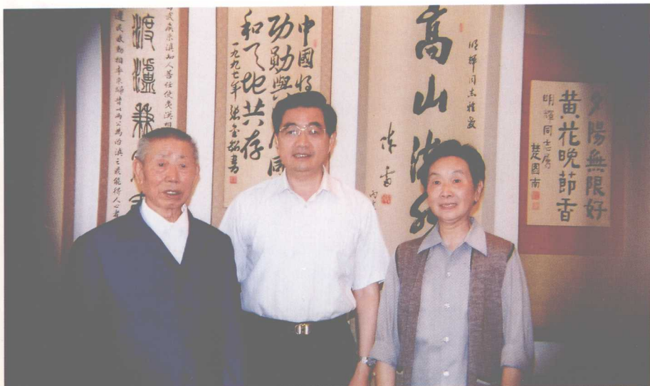
2002年7月17日，中共中央政治局常委、国家副主席胡锦涛同志（中）到家里看望