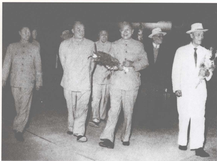
1964年9月与阎红彦同志（左二）一起去昆明机场迎接国务院副总理李先念同志（左三）和越南黄文欢总理。