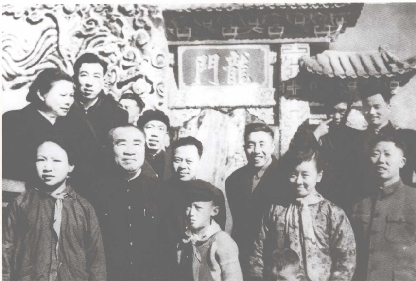
1959年陪同朱德委员长（前排左二）和夫人康克清同志（后排左一）在西山龙门参观时合影。后排左二为李东冶同志，左八为副省长赵增益同志。