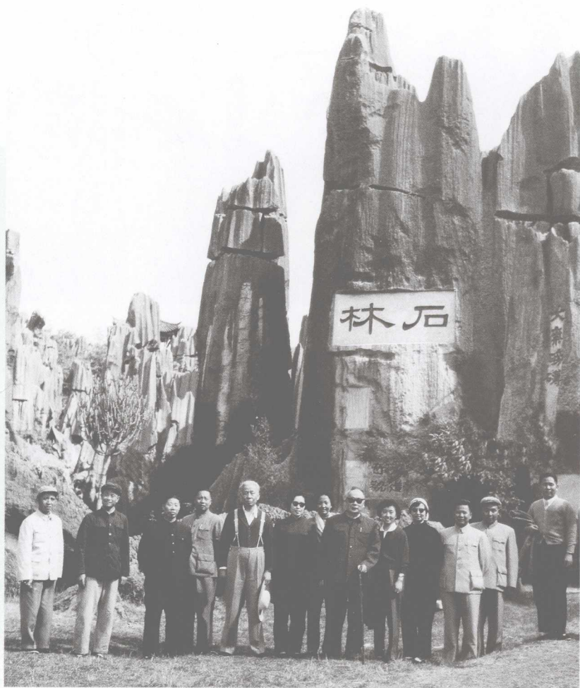
陪同国家主席刘少奇（左五）、副总理陈毅（右六）参观石林。图片左一、二为路南县委二同志、左三为刘明辉、左六为王光美、右五为郭学桢、右三为陈康、右二为丁荣昌同志