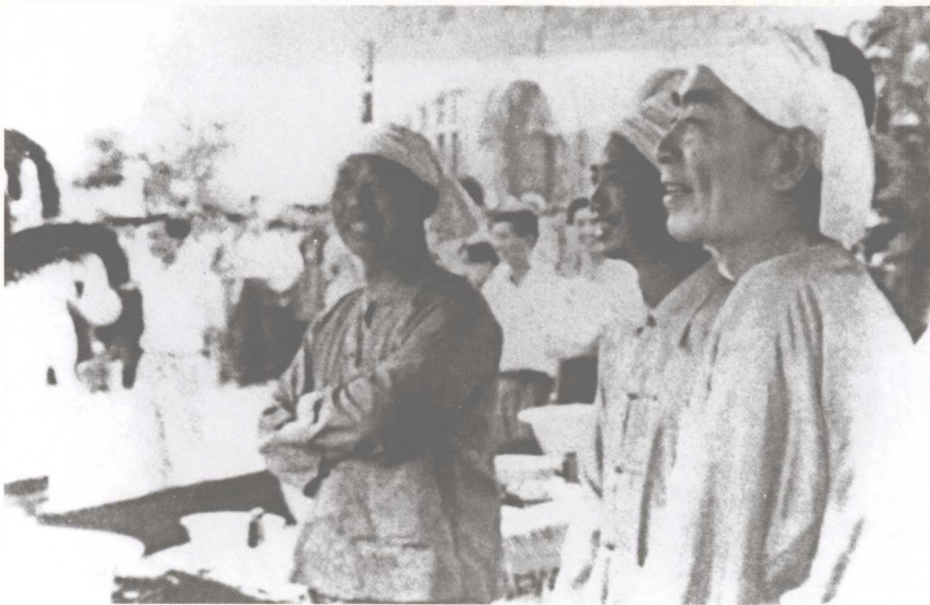
陪同周恩来总理（右一）参加西双版纳泼水节。