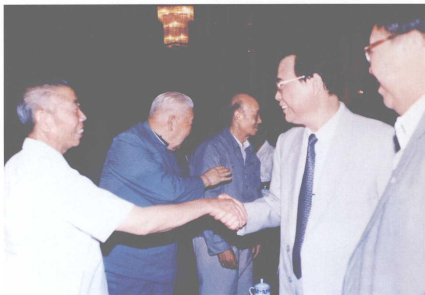
1990年8月15日，与国务院总理李鹏同志（右二）在一起