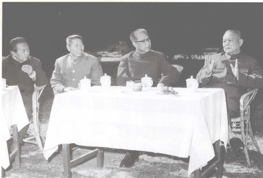
向国家主席李先念（右一）汇报工作。左三为安平生同志