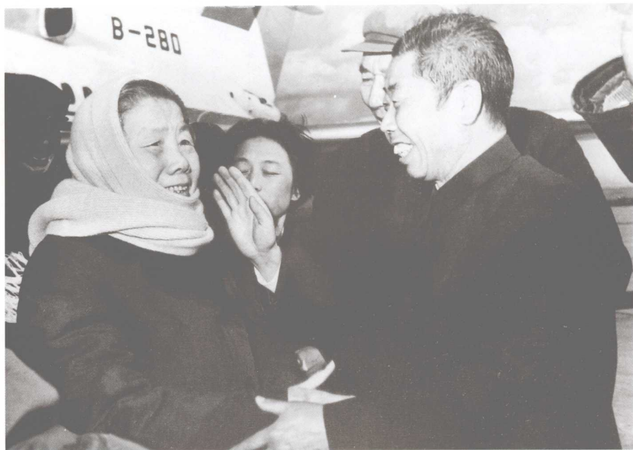
到昆明机场迎接全国人大副委员长邓颖超同志（左一）