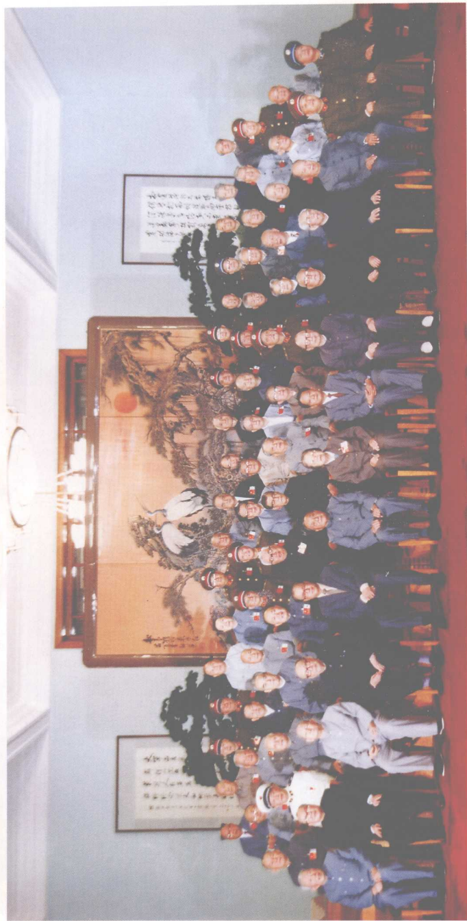
1985年9月，在党的十二届四中全会上，中央同意64位中央委员、候补委员辞去职务，退居二线的请求。会后中央政治局的同志与大家合影。（第四排右五）