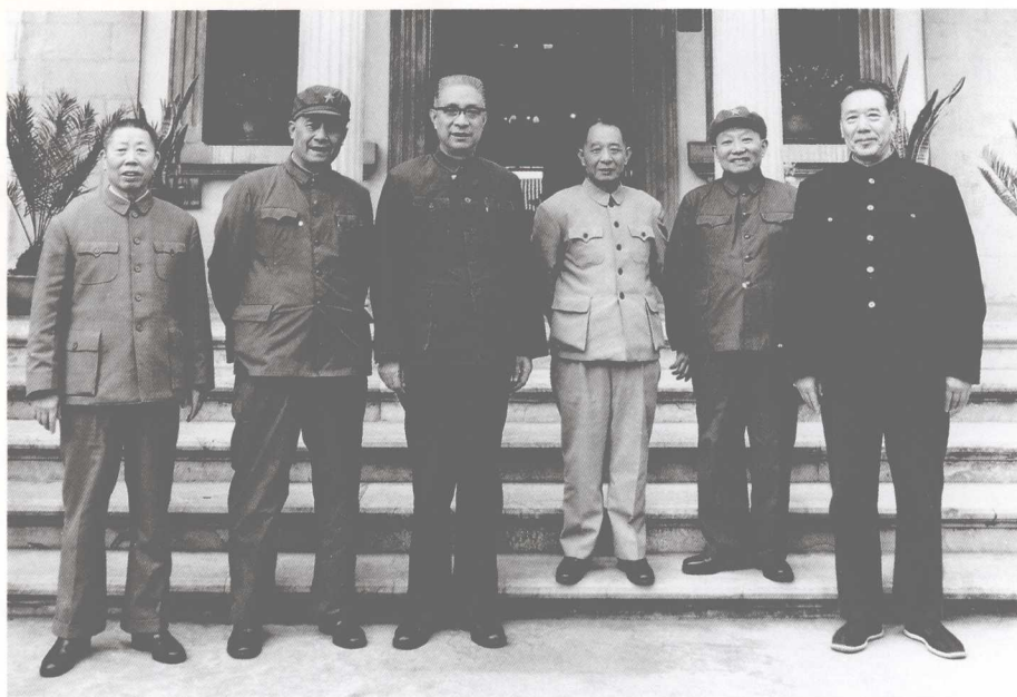
中共中央总书记胡耀邦同志与云南党政军负责同志合影（从左至右：刘明辉、张钰秀、安平生、胡耀邦、刘志坚、李启明同志）