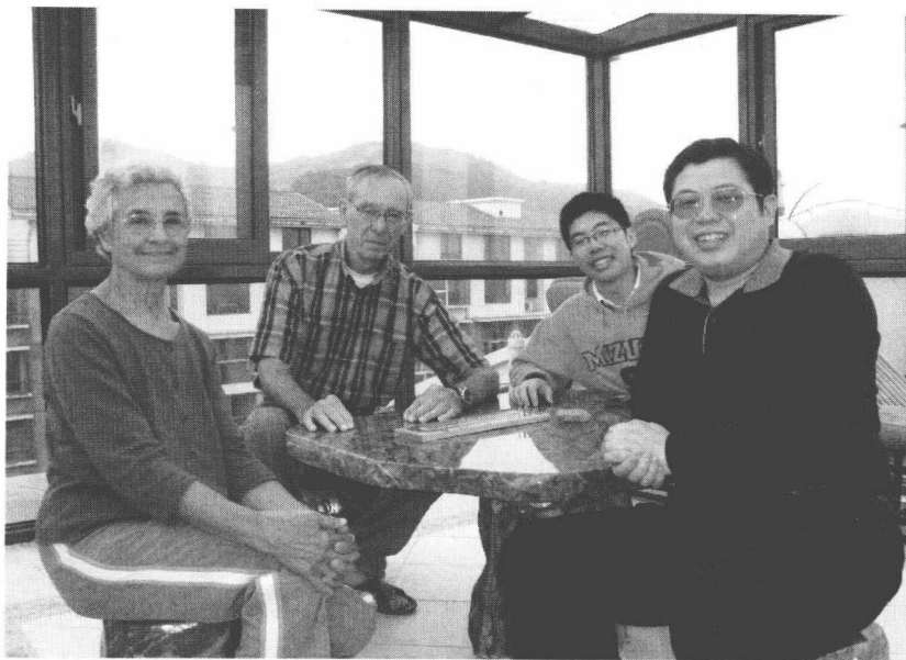
▲ 和沃特先生与凯西女士在作者南京的家中